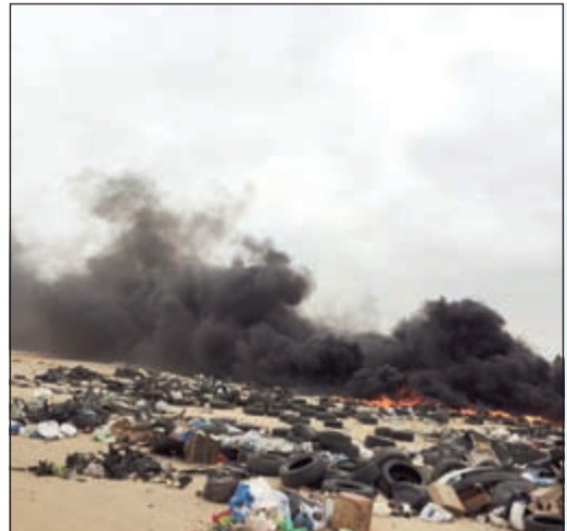
من حريق السكراب

أخمد رجال إطفاء تيماء حريقا شب في مخزن سكراب السيارات، وكان بلاغ قد ورد إلى عمليات الإطفاء بنشوب حريق في مخزن سكراب سيارات عند الكيلو 40 فتوجهت إليه فرقة إخماء الجهراء وتعاملت معه حيث تمكنت من إخماده دون حدوث أية إصابات. من جانب آخر تمكن رجال إخماء الواحة من إخماد حريق شب في إطارات السيارات بدوار الصندلي من جهة أخرى تسبب حريق مخيم في النيران 3 خيام متلاصقة، وقال مصدر أطفائي ان بلاغا بحريق مخيم في الصبية تم تلقيه والتعامل معه وسارع رجال الأمن إلى موقع البلاغ وتبين ان النيران اتت على 3 خيام.