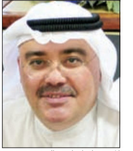
المستشار إبراهيم العبيد

قضت الدائرة الجزائية الخامسة بمحكمة الاستئناف أمس برئاسة المستشار إبراهيم العبيد بتأييد حكم محكمة أول درجة القاضي بحبس المتهمين الأول والثاني والخامس والسادس والسابع، عشر سنوات مع الشغل والنفاذ بينما برأت المتهمين الثالث والرابع في الدعوى المرفوعة ضدهم من الإدارة العامة لمباحث أمن الدولة والمتهمين فيها بتأييد وتمويل «داعش».