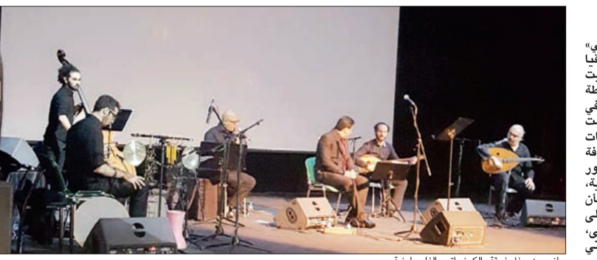
جانب من حفل فرقة «الكمنجاتي» الفلسطينية

وقدمت الفرقة خلال الحفل مجموعة من الوصلات الغنائية والموسيقية الجميلة المستوحاة من الفن العربي والتي تتفاعل معها الحضور بشكل كبير، حيث انطلقت الأمسية الطربية مع مقطوعة سماعية، وقدمت أداء جماعيا ومقطوعات من وحي الأندلس، وممزوفات متنوعة خلقت مزججا استثنائيا من العواطف والمشاعر. وظهر في الحفل