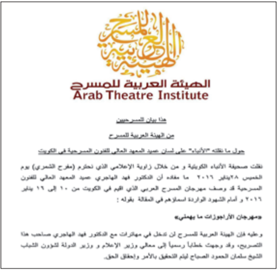
رد الهيئة العربية للمسرح