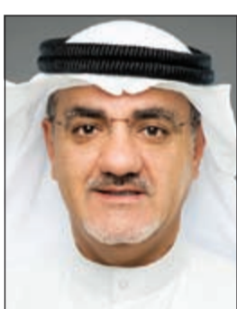
د. خليل عبدالله

وجه النائب د.خليل عبدالله الغريب وزير التعليم العالي د.بدر العيسى قال في مقدمته: إنه ونظراً للمعاناة المعهد العالي للفنون المسرحية من أزمة ساهمت في تراجعها نتيجة وجود مخالفات إدارية ومالية ساعدت على تدني مستوى العمل الأكاديمي فيه، رغم أنه قد أنشئ للمحافظة على تراثنا الوطني السدي وضعه الآباء المؤسسون من أهل الكويت المثقفين والفنانين، حيث نمت إلى علمي أن بعض محاضرات عميد المعهد ومساعدي العميد ورؤساء الأقسام العلمية تتم خارج أوقات دوامهم الرسمي وما شاب ذلك من مخالفات،