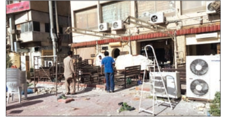
إزالة المخالفات المخالفة