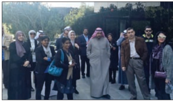
مهندسو KISR و«الأرجان» خلال جولة ميدانية في مقر الشركة

يعد أول مبنى حاصل على اعتراف LEED البلاتينية في الكويت. وتهدف الأرجان من خلال هذا التعاون الى نقل خبرتها في إدارة المباني الخضراء لأعضاء منظمة الأبحاث العلمية ومعرفة معايير الاستدامة العالمية التي تتبناها الشركة في مقرها الرئيسي، والذي