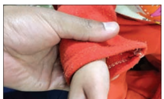
إصبع الطفل الذي انحشر