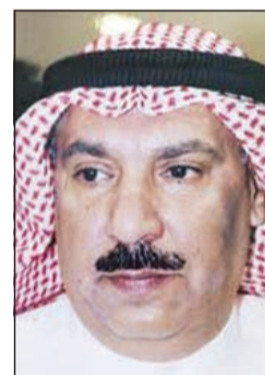
العميد عبدالرحمن الصهيل

سجن. وبحسب مصدر أمني فإن معلومات وردت إلى العميد الصهيل عن مواطن يتاجر في أسلحة سورية هربها إلى داخل البلاد قبل فترة، وعليه تم التواصل مع النيابة العامة والتنسيق عبر مصدر مع المتهم لبيع سلاح شوزن مقابل 650 ديناراً. وقال المصدر: تم الاتفاق على أن يكون