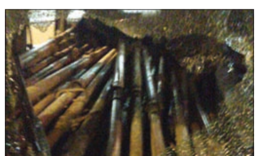
المسروقات بدت واضحة من السيارة المخالفة لشروط الأمن والمتانة