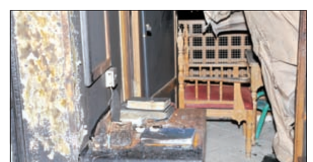
آثار الحريق في الغرفة الفندقية بالسالمية