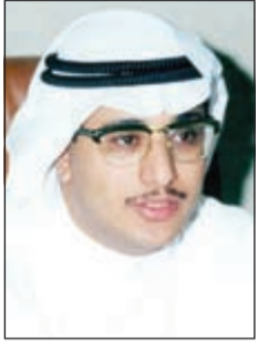
المستشار عبدالرحمن الدارمي

حددت الدائرة السابعة بمحكمة الاستئناف أمس برئاسة المستشار عبدالرحمن الدارمي وأمانة سر فارس القصاب جلسة 17 فبراير المقبل لنظر قضية أمن الدولة رقم 2016/302 المعروفة إعلامياً بقضية «خلية العبدلي»، والمتهم فيها 25 مواطناً بالإضافة إلى