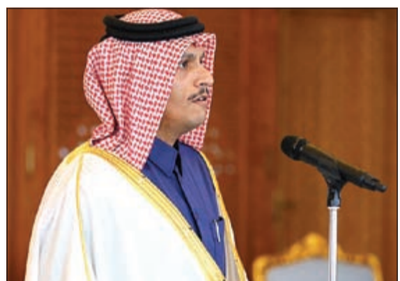
الشيخ محمد بن عبدالرحمن آل ثاني أثناء أداءه اليمين القانونية وزيراً للخارجية أمس

الدوحة - قنا: أجرى أمير قطر سمو الشيخ تميم بن حمد آل ثاني، تعديلاً وزارياً أمس، شمل تعيين وزير جديد للخارجية ودمج عدة حقائب وزارية. وأصدر الشيخ تميم بن حمد، أمراً أميرياً بإسناد حقيبة الخارجية إلى الشيخ محمد بن عبدالرحمن آل ثاني، في حين تم تعيين سلفه خالد بن محمد العطية وزيراً للخارجية المنتهية ولايته، ووزيراً للدولة لشؤون الدفاع وعضواً بمجلس الوزراء.