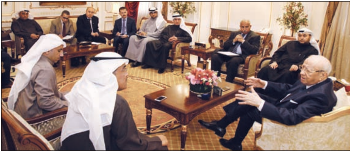
الرئيس التونسي الباجي قائد السبسي في حديث مع نائب رئيس التحرير الزميل عدنان الراشد على هامش لقائه مع رؤساء تحرير ومندوبي الصحف المحلية

السبسي: العلاقات الكويتية - التونسية «نموذج تاريخي»