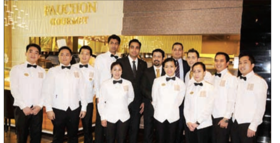
فريق عمل مطعم فوشون باريس «لوغورميت كافيه»