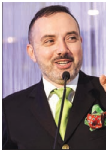
السفير الفرنسي كريستيان نخلة