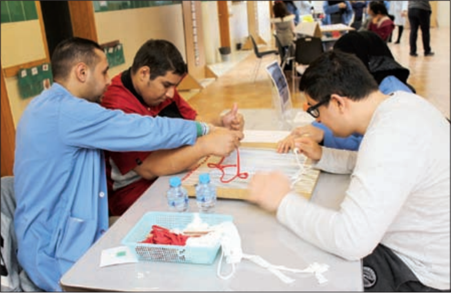
أنشطة تربوية وتعليمية

الفردية والجماعية لتنمية وإبراز مهارات الطفل واستثمار أوقات فراغه في الترفيه بعيدا عن الجو الدراسي، وفي جو أسري يساهم في اندماج الطفل التوحدي بالاجتماع من خلال الالتقاء بالأشخاص الآخرين في الرحلات والزيارات الخارجية واللعب والتعلم من طلبة المدارس والمشاركة معهم كأصدقاء للتوحد وكل ذلك لرسم الإبتسامة على وجوه الأطفال وإسعادهم، وكان أنشطة مميزة مرت أوقاتها بسرعة.