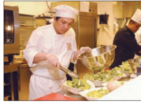
الشيف يحضر أطباق السلطة الشهية