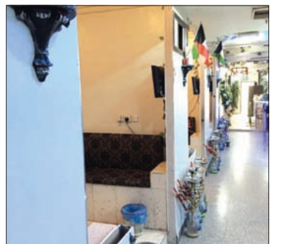
إزالة أبواب الكباين المخالفة

شن فريق طوارئ بلدية الجھراء حملات مكثفة على مدى الأسبوع الماضي استهدفت الكباين المغلقة والمخالفة للألحة المحلات بالمقاهي والمطاعم الواقعة