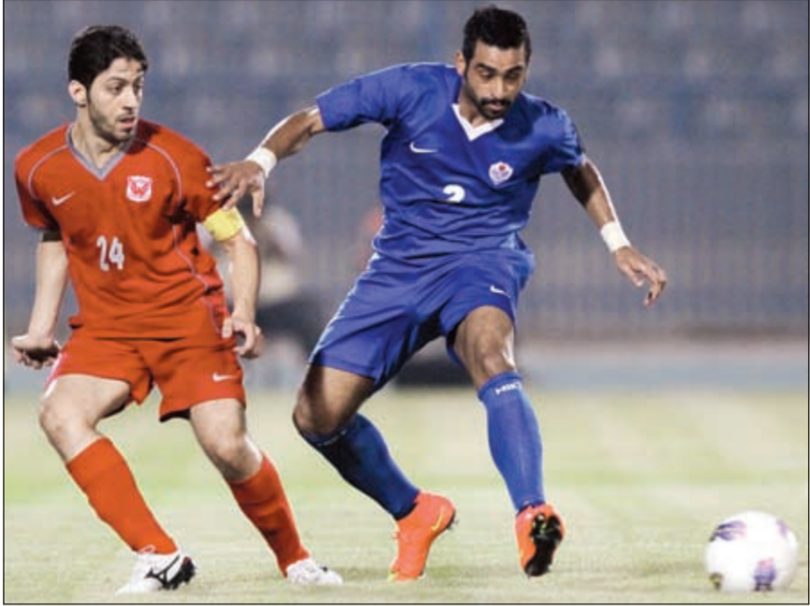
مواجهة متكافئة بين الفحيحيل والشباب في الدور التمهيدي للبطولة الغالية