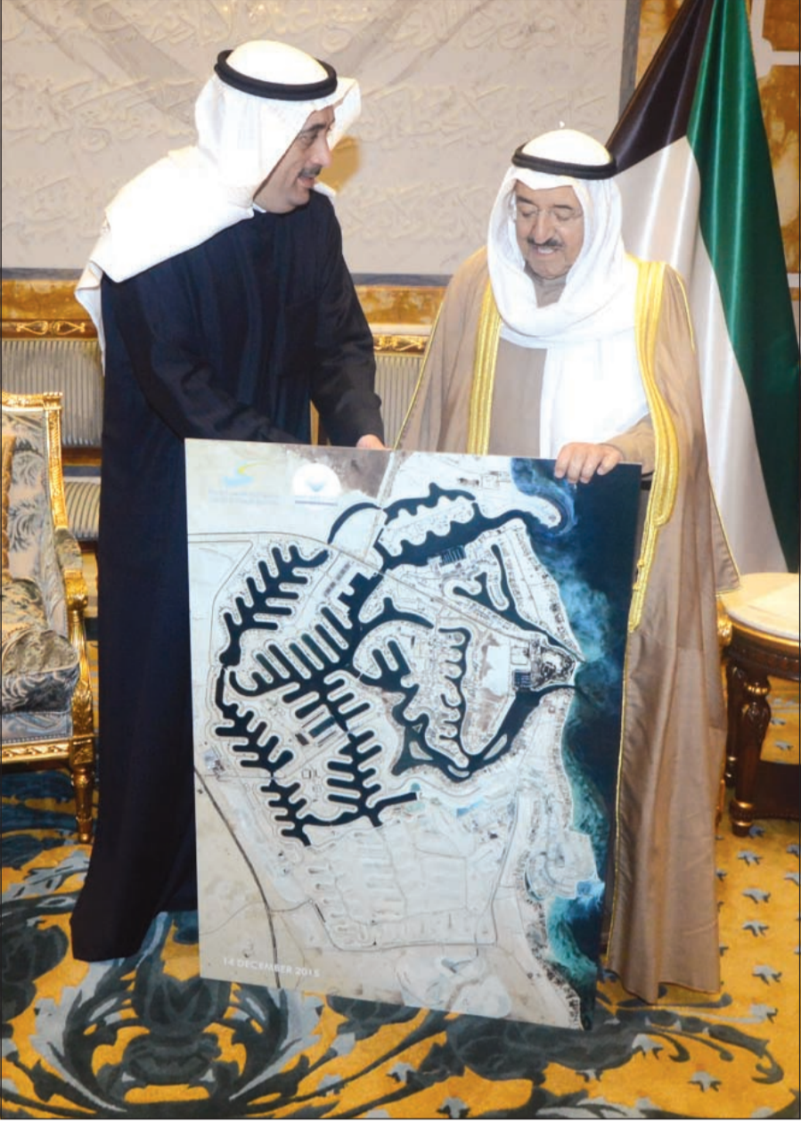
صاحب السمو الأمير الشيخ صباح الأحمد خلال استقباله السيد فواز خالد المرزوق