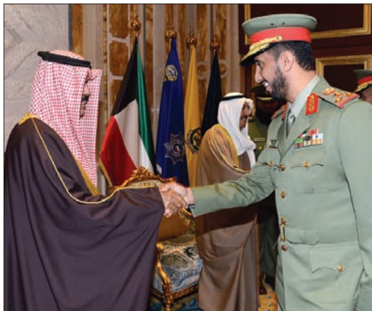
سمو ولي العهد مضافا العميد ركن بدر عبدالله