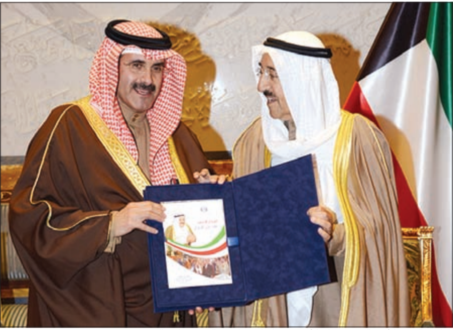
صاحب السمو الأمير الشيخ صباح الأحمد يتسلم الإصدار من الشيخ مبارك الدميح

صباح الأحمد، رعا الله، ونشأته، وملامح شخصيته، والخبرات التي اكتسبها خلال معاشته لقيادة الكويت، والنجاحات التي حققها سموه، رعا الله، في المواقع التي عمل بها، والمناصب التي تولاها عبر مشواره السياسي. كما يتناول الفصل الثاني رؤية صاحب السمو الأمير الشيخ صباح الأحمد، في الحكم وأولوياته التي حددها لمستقبل زاهر للكويت وأبنائها، إضافة إلى التقدير الكبير الذي حظي به سموه في العالم سواء لجهوده الدبلوماسية أو لأعماله الإنسانية أو لدوره في تحقيق الأمن والسلام في العالم. ويلقي الفصل الثالث الذي أعدته شيماء راشد الرويشد الباحثة بمركز الأبحاث في (كونا) تحت عنوان «الشيخ صباح الأحمد.. مهندس السياسة الخارجية، الضوء على دور عميد الدبلوماسية في إعلاء مكانة الكويت في العالم وتعزيز وجودها في المحافل الإقليمية والدولية.