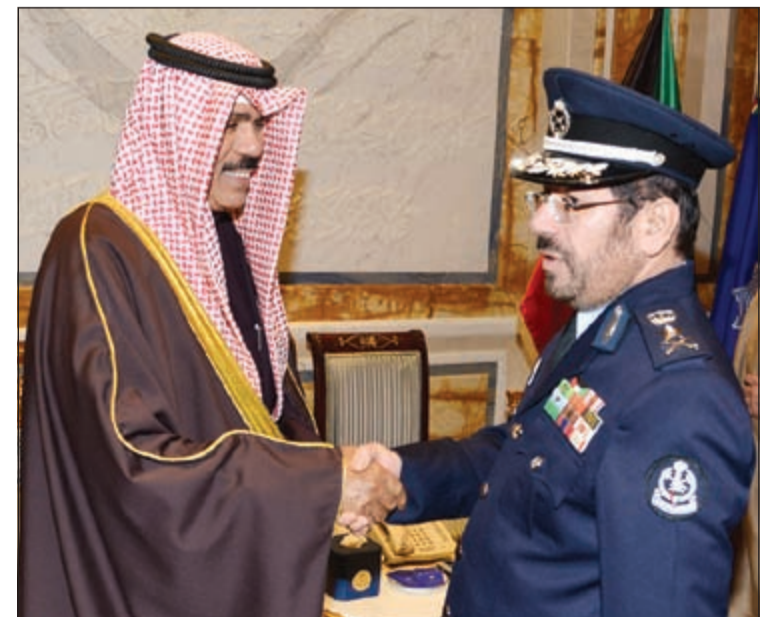
سمو ولي العهد مستقبلا الفريق يوسف الأنصاري