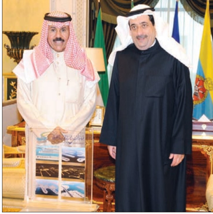
سمو ولي العهد الشيخ نواف الاحمد خلال استقباله السيد فواز خالد المرزوق