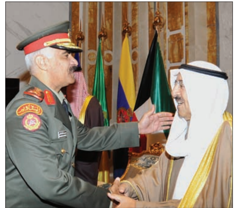
صاحب السمو مضافا الفريق الركن محمد الخضسر