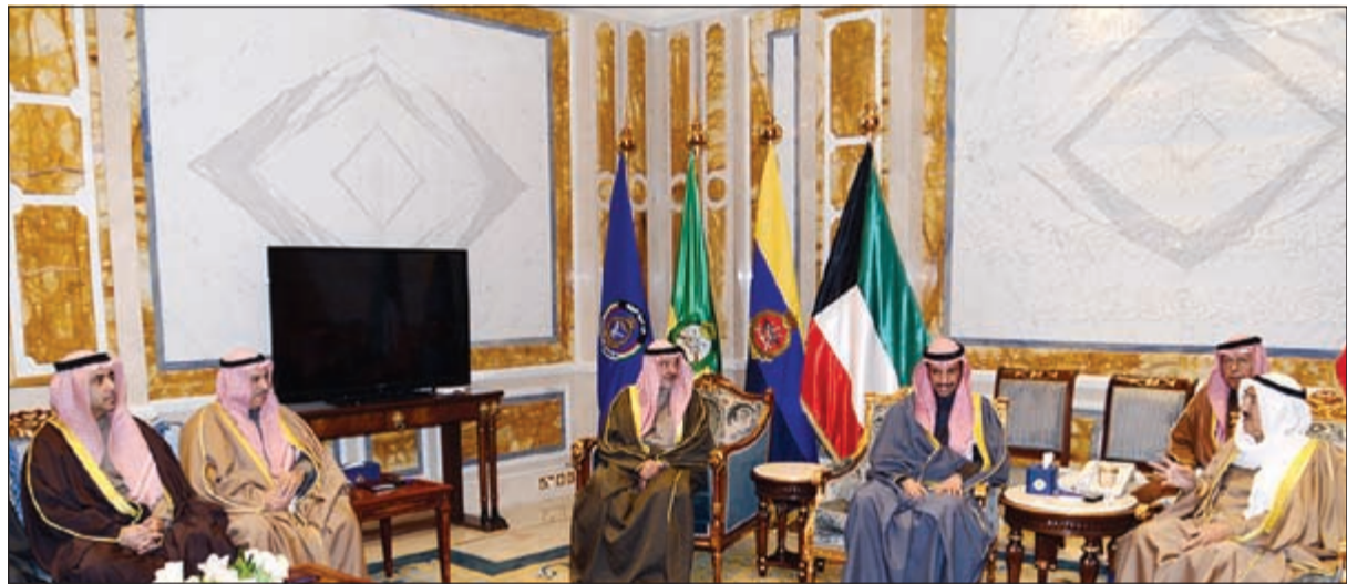
صاحب السمو الأمير مستقبلا مرزوق والغانم وأعضاء الشعبة البرلمانية المشاركين في مؤتمر اتحاد مجالس الدول الأعضاء في منظمة التعاون الإسلامي

استقبل صاحب السمو الأمير الشيخ صباح الأحمد بقصر بيان صباح أمس سمو ولي العهد الشيخ نواف الأحمد