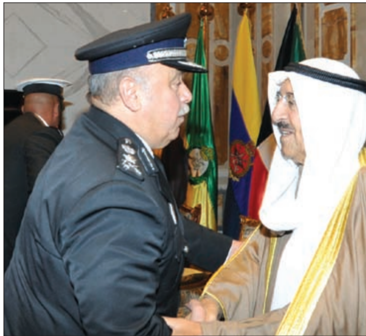
صاحب السمو مضافا الفريق سليمان الفهد

بصاحب السمو الأمير الشيخ صباح الأحمد بقصر بيان صباح أمس وبحضور سمو ولي العهد الشيخ نواف الأحمد