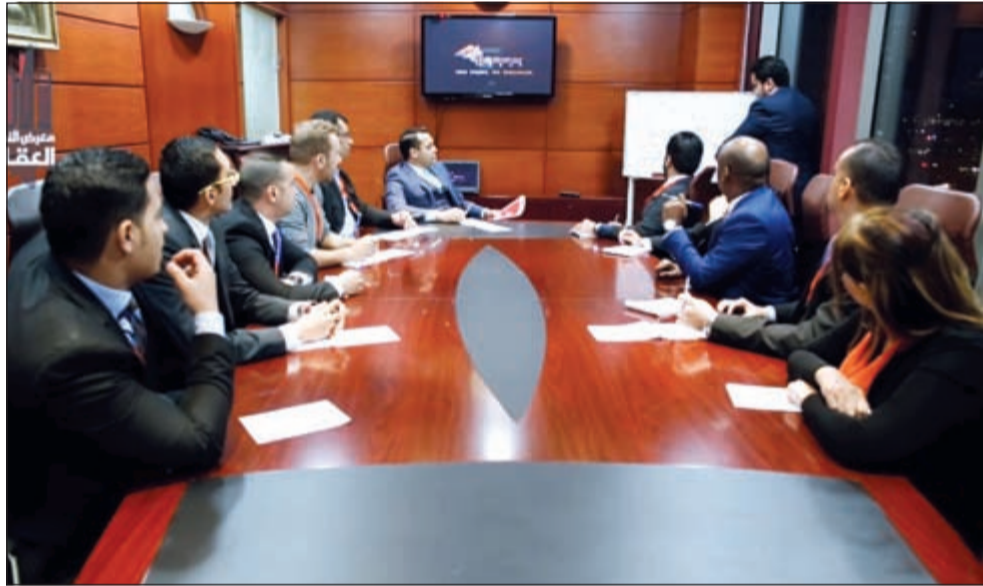
من استعدادات إسكان جلوبل لإطلاق معرض النخبة العقارية