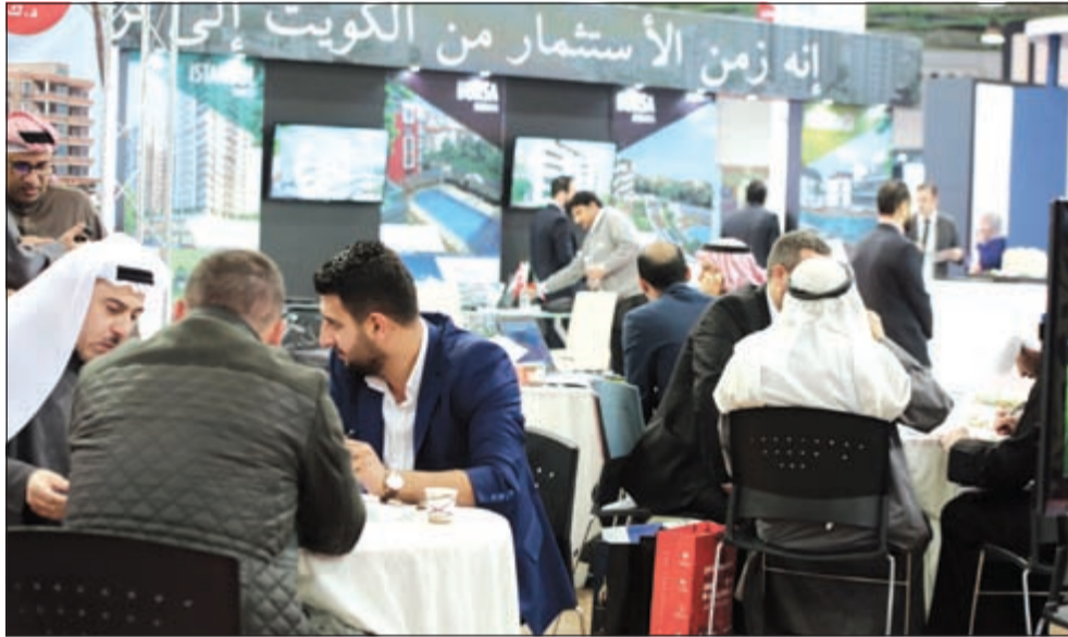
جانب من معرض النخبة العقارية الأخير