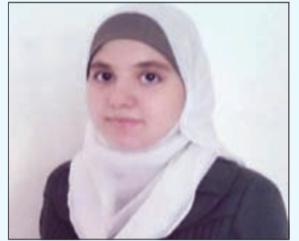
يقين تشارك بقصيدة في يوم الاستقلال بالأردن

المزيد أيضاً. إلى أي فن من فنون الكتابة تجدين في نفسك ميلاً أكثر؟ ● كتابة الشعر والخواطر. هل تتوقعين الفوز في مجال الشعر بمسابقة وزارة التربية والتعليم على مستوى المملكة؟ ● أتمنى أن أحقق الفوز، وإن لم أكسب في هذه المسابقة فقد نلت شرف المحاولة. ما طموحاتك في مجال الكتابة الأدبية؟ ● أن أكتب مزيداً من الأعمال الأدبية، وأجمع أعمالاً في كتاب واحد، وأن أظهر موهبتي على مستوى أكبر. هل فزت بمسابقات مهمة أخرى في السنوات الماضية؟ ● نعم في مسابقة الإبداع الطلابي لأكثر من مرة، وفي مسابقة للشعر على مستوى العقبة، وحصلت على لقب شاعرة مدينة العقبة آنذاك.