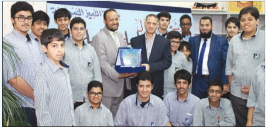
مجموعة من المشاركين في الورشة مع وكيل الشؤون الفنية فوزي الشعبي

فوزي الشعبي: حرص الطالب على تنمية نفسه مفتاح النجاح