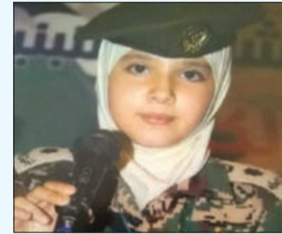
د. شاعرة تركية مدينة العقبة، نالتها الطالبة يقين