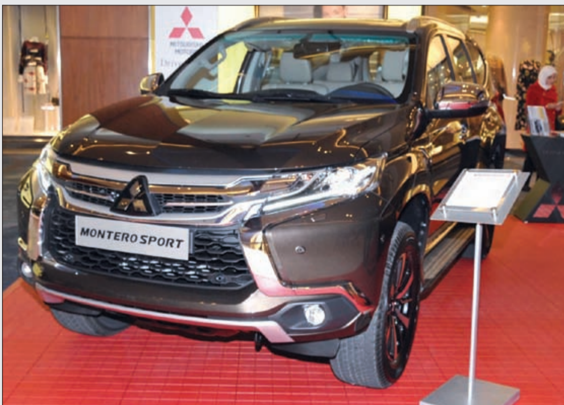
ميتسوبيشي مونتيرو سبورت

السير بسرعة تصل إلى 100 كلم يكون وضع القيادة الصحيح دائماً بمثابة دليل. وزودت مونتيرو سبورت بأنظمة صوتية ومرئية متطورة للغاية، فتتميز بشاشة لمس ملونة بالكامل بمقاس 6,1 بوصات، وترتبط العارضة أيضاً بكاميرا الرؤية الخلفية. كما زودت بنظام صوتي عالي القدرة 420 و 8 سماعات. وتأتي مونتيرو سبورت 2016 بمحرك سعته 3,0 بحجم 6 اسطوانات 24 صماماً يقدم مقداراً مدهشاً من القوة للقيادة على الطرق الرئيسية المفتوحة وكذلك الوعرة. كما تتميز المحرك الجديد بمقدار كبير من عزم الدوران لمنحك قدرة عالية عند سحب أحمال ثقيلة ويمكنك من اجتياز أوضاع القيادة الصعبة بكل ثقة. كما شهد التصميم الجديد لاولاندز الجديدة كلياً تحولاً مثيراً بتحديثاتها الجديدة التي اشرف عليها أكثر من 100 مهندس ومصمم عمل على تحسين وتجديد اولاندز للامة متطلبات معظم سائقي السيارات. فالتصميم الجديد أصبح أكثر مرونة وانسيابية، وهو الأمر الذي منحها هدواً أكبر على الطرقات التي منظرها السابق نظراً إلى التصميم الثوري الجديد وأقراص التعليق الحديثة ونظام العزل الصوتي الذي استخدم في بناء السيارة.