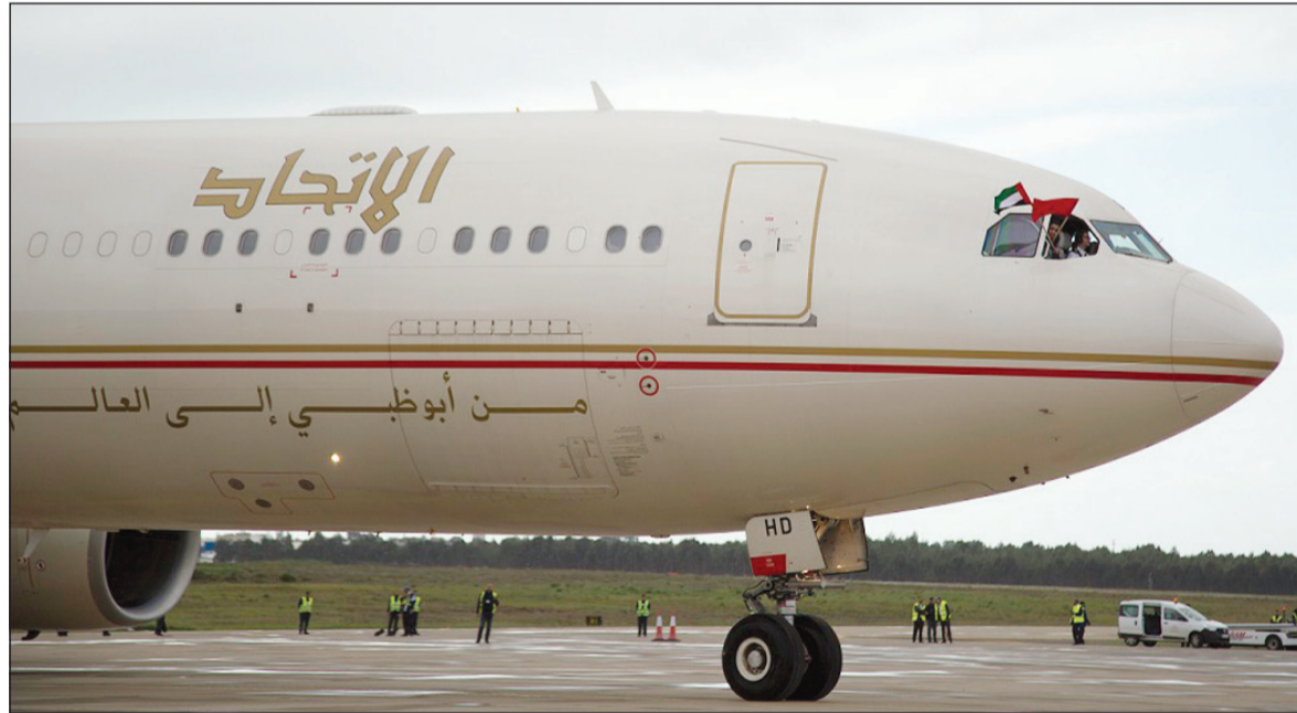
طائرة «الاتحاد» على مدرج «مطار الرباط سلا الدولي»

أعلنت الاتحاد للطيران، الناقل الوطني لدولة الإمارات العربية المتحدة، عن إطلاق رحلاتها من أبوظبي إلى العاصمة المغربية الرباط التي أصبحت ثاني الوجهات المنتظمة للشركة في المغرب. وهيبت الرحلة الافتتاحية في «مطار الرباط سلا الدولي» وانطلقت مدافع المياه الاحتفالية في تحية تقليدية للطائرة فور وصولها. وتلا ذلك إقامة مراسم استقبال حضرها نخبة من كبار الضيوف والمسؤولين وعلى رأسهم معالي لحسن حداد، وزير السياحة المغربي، وسعادة العمري سعيد الظاهري، سفير دولة الإمارات العربية المتحدة لدى المملكة المغربية. وتعد خدمة الرحلات الجديدة، التي توفرها الاتحاد للطيران بمعدل رحلتين أسبوعياً عبر طائرة من طراز إيرباص 340-500 المرتبة بنظام الدرجات الثلاث، الرباط الجوي المباشر الوحيد بين العاصمتين. ومع رحلات الشركة القائمة بالفعل بين أبوظبي والدار البيضاء بمعدل رحلة يومياً، يرتفع بذلك عدد رحلات الاتحاد