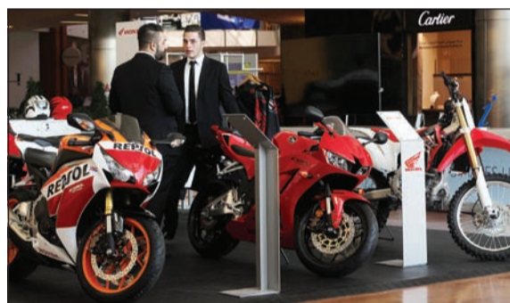
ركن خاص بالدرجات النارية

لعشاق هوندا للحصول على مزايا الخصم الفوري أو عقد الصيانة المجاني ضمن العرض المتاح أيام المعرض حصرياً للاستمتاع بقيادة هوندا حيث يمكن الاختيار بين سيارات هوندا الحديثة التي تضم إضافة إلى بايلوت وأكورد سيدان، كلا سي آر سي في وأكورد كوبيه والمتوافرة بألوان مختلفة. تعد «الغانم موتورز» الموزع الحصري في الكويت لمنتجات هوندا من السيارات ومنتجات ومعدات الطاقة، بالإضافة إلى المحركات والمعدات البحرية، والدرجات النارية، وتلتزم الشركة بأعلى مستويات الجودة في الخدمة المتخصصة والتي تعمل وفق أشد المعايير العالمية صرامة وجودة فيما يتعلق بالخدمة النوعية التي يقوم بها اختصاصيون وتقنيون مؤهلون وباستخدام أحدث المعدات وأفضل قطع الغيار الأصلية. ويتميز مركز خدمة سيارات هوندا الموجود في الري بتصميمه الواسع والحديث، وبقاعة انتظار عصرية توفر خدمات رفاهية مميزة للعملاء أثناء انتظارهم تشمل كراسي مساج، ركن ألعاب إلكترونية، ستايلات وإنترنت لاسلكياً مجاناً.