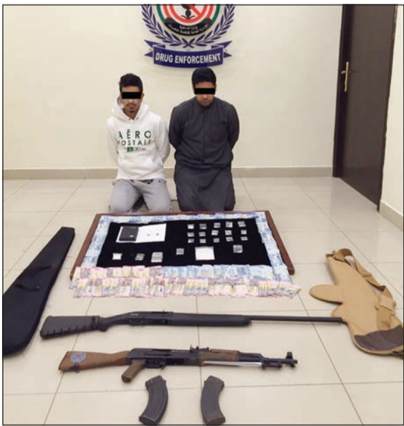
المواطنان أمامهما المضبوطات

تمكنت الادارة العامة لمكافحة المخدرات من ضبط مواطنين في جواخير كبد وعثر بحوزتهم على 200 غرام شبو وعدد 2 أسلحة نارية رشاش ومبلغ مالي وقدره 3800 دينار. وتمت مصادرة بيع المخدرات، وتم إحالتهم إلى نيابة المخدرات حيث الاختصاص. وفي التفاصيل التي يرويها المصدر أن معلومات وردت إلى رجال المكافحة عن قيام شاين بالتعاطي والترويج لمادة الشبو المخدرة ليتم مراقبتهم ورضدهم بمنطقة كبد حيث تم قاسما بمقاومة رجال المكافحة الذين اتضح بأنهما مواطنين وتمت إحالتهم إلى جهة الاختصاص.