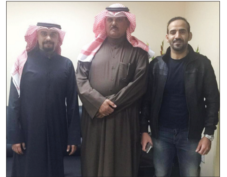
رجال الجمارك في صورة جماعية بعد عملية ضبط الكمية

من الحبوب المخدرة والتي وصل عددها إلى 23 ألف حبة. وقال مصدر أمني إن رجال الجمارك وتحديدًا قسم البحث والتحري في قسم الشحن الجوي بمطار الكويت اشتبهوا في شخص اتضح أنه سوري الجنسية فتم التنسيق مع المباحث ومراقبة الشخص الذي قام بشحن قطعة «جبر شيروكي» إلى البلاد، وأن القطعة الحديدية محشوة بحبوب مخدرة، وعند اكتشاف الأمر حاول الوافد السوري وشريكه الهرب ولكن تم ضبطهما، وتبين أن شريكه مواطن وخرج مؤخرًا من السجن