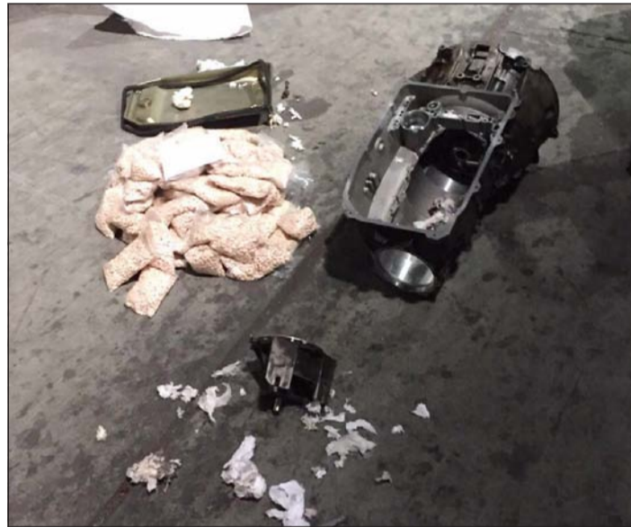
الجرب بعد اكتشافها داخل «الجبر»