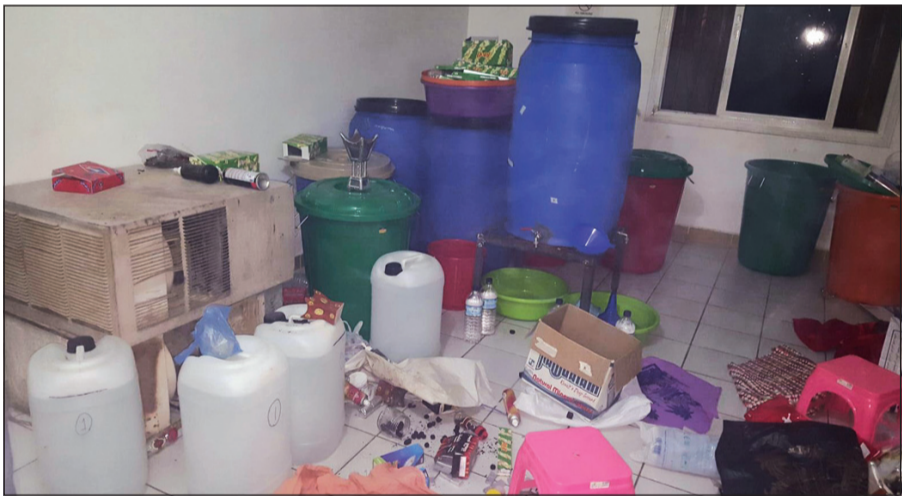
البراميل وأدوات التقطير