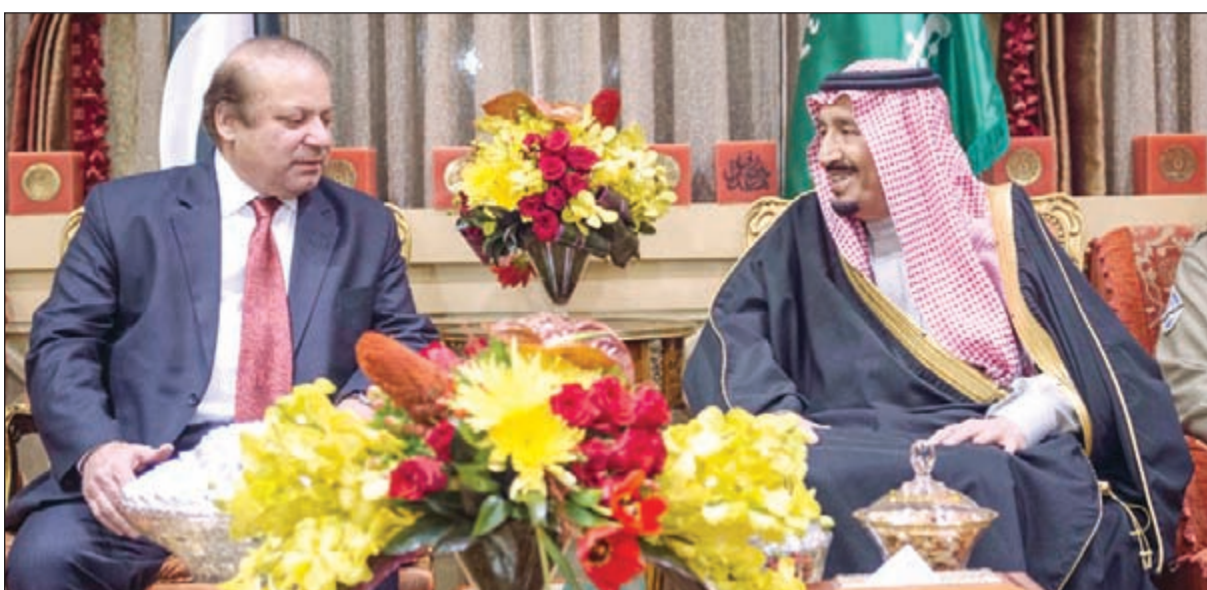
خادم الحرمين الشريفين الملك سلمان بن عبدالعزيز خلال استقباله رئيس وزراء باكستان نواز شريف في الرياض أمس (واس)

هم من المسلمين في شتى أنحاء العالم. وأوضح وزير الثقافة والإعلام د.عادل بن زيد الطريفي في بيان بثته وكالة الأنباء السعودية الرسمية «واس»، عقب الجلسة أن مجلس الوزراء استمع بعد ذلك وبترجيح من خادم الحرمين إلى نتائج زيارتي صاحب السمو الملكي الأمير محمد بن سلمان ولي ولي العهد النائب الثاني لرئيس مجلس الوزراء وزير الدفاع إلى دولة الإمارات العربية المتحدة، وباكستان. وأثنى مجلس الوزراء على ما قامت به قوات تحالف دعم الشرعية في اليمن، ومركز الملك سلمان للإغاثة والأعمال الإنسانية من إيصال المساعدات الطبية والإغاثية للمحاصرين في مدينة تعز من خلال عمليات إنزال جوي للمساعدات الطبية والمواد الغذائية والإغاثية.