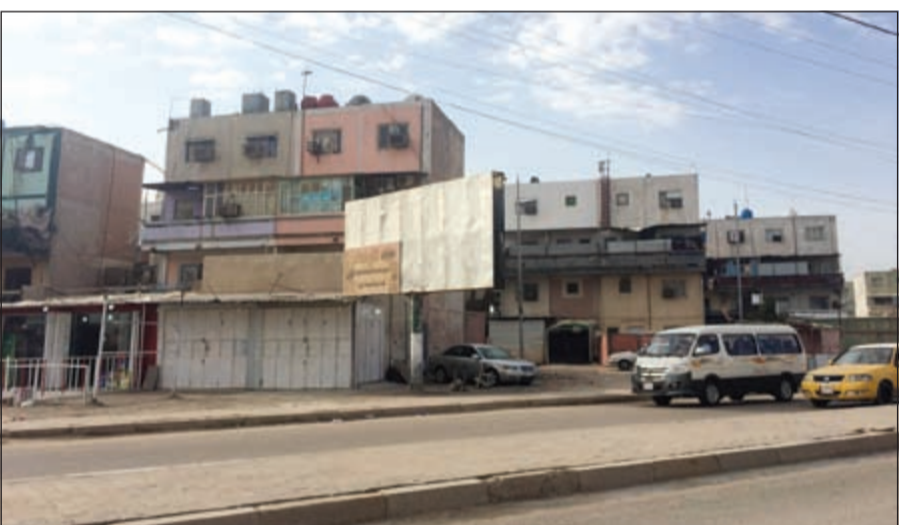
صورة خارجية للمبنى الذي به الشقة التي اختطف منها الأميركيون الثلاثة جنوب بغداد

سكني في حي الدورة، وأكد عقيد في الشرطة العراقية طلب عدم كشف هويته لوكالة فرانس برس، أن ثلاثة أميركيين ومترجمهم العراقي خطفوا في جنوب بغداد، لافتاً إلى أن عملية البحث تتركز حالياً على جمع المعلومات الاستخباراتية. وكانت مصادر أمنية عراقية قد أكدت أن رجال ميليشيات مسلحين يرتدون زي القوات العراقية نفذوا عملية الاختطاف، وأقتادوا الأميركيين الثلاثة ومترجمهم إلى مكان مجهول. وأقامت قوات الأمن العراقية نقاط تفتيش على الطرق في جنوب شرق بغداد وأرسلت طائرات هليكوبتر بعد تأكيدات عن اختفاء المواطنين الأميركيين. وشوهدت طائرتان هليكوبتر للجيش العراقي تحلقان فوق المنطقة، فيما قامت سيارات الشرطة بدوريات في الشوارع. وكان حي الدورة -الذي تم فيه الاختطاف وتقتلته أغلبية سنية- معقلاً لمقاومة الغزو الأميركي عام 2003 ومسرحاً لقتل طائفي بلغ ذروته في عامي 2006 و2007.