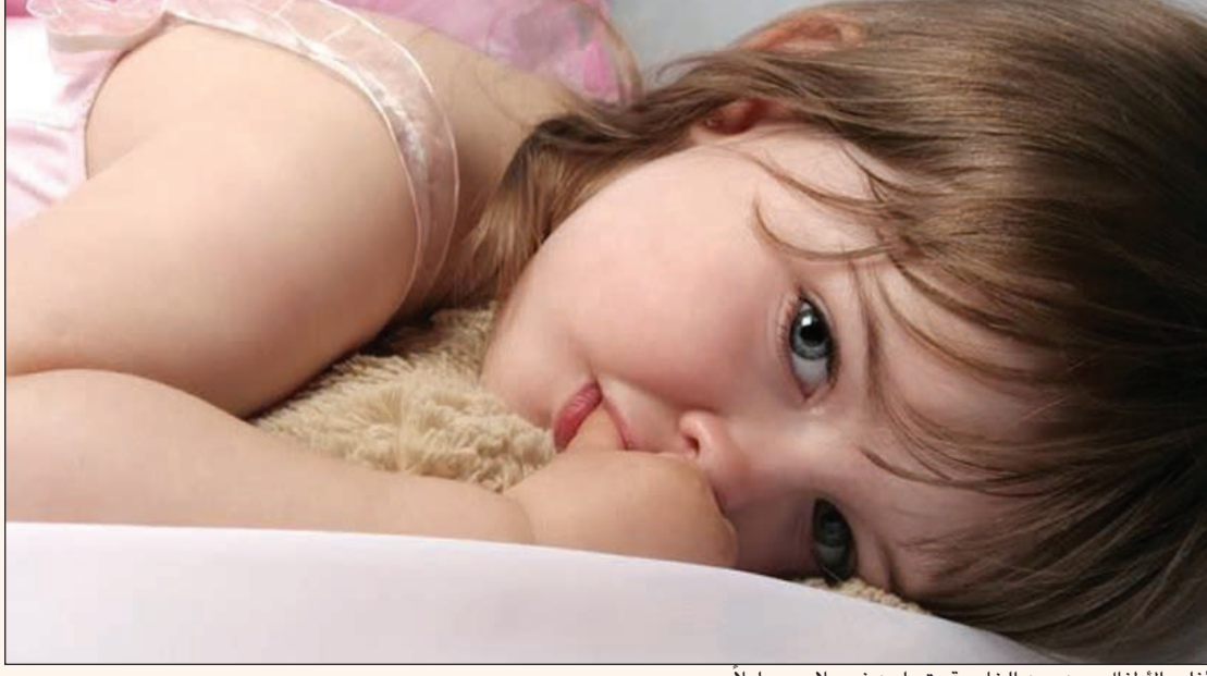
أغلب الأطفال دون سن الخامسة يتبولون في ملابسهم ليلاً

ما التبول اللاإرادي عند الأطفال؟ ● المشكلة التي يواجهها الطفل أنه لا يستطيع التحكم في البول، سواء كان التبول أثناء النهار أو أثناء الليل والتشخيصان يختلفان عن بعضهما البعض. أغلب الأطفال إلى سن الخامسة يتبولون في ملابسهم ليلاً، وهذا شيء طبيعي، من سن الخامسة 15٪ من الأطفال لا يزالون يتبولون على أنفسهم ليلاً وفي هذه المرحلة إذا كان الطفل مازالت لديه هذه الشكوى توجه الأم إلى نصح سلوكية لتلقيها