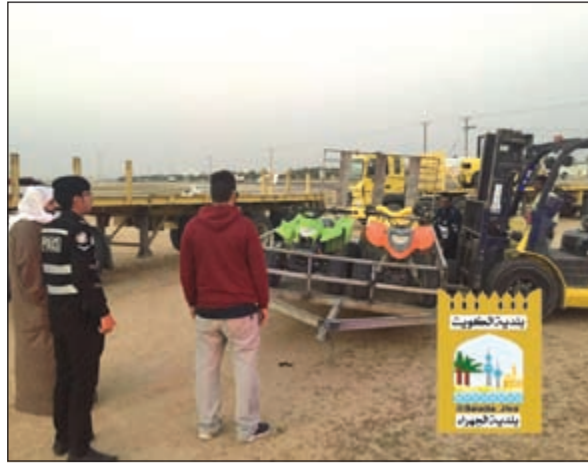
ليات البلدية تصادر بقيات في كبد