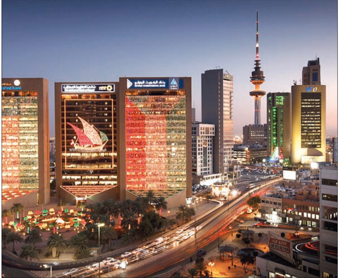
أسهم البنوك تهاوي أمس لمستويات تاريخية وسط الضغوط على الأرباح وزيادة المخصصات

قالت مصادر مصرفية لـ «الانباء»: إن حجم المخصصات التي ستحتجزها البنوك عن السنة المالية 2015 سترتفع بمستويات قياسية مقارنة بعام 2014 الذي احتجزت فيه البنوك نحو 480 مليون دينار، وذلك بناء على طلبات بنك الكويت المركزي زيادة المخصصات المحددة والعامه المطلوبة بسبب الانكشاف الكبير للبنوك على سوق المال الكويتي. ومن المرجح أن ترتفع المخصصات بين 25 و30٪ لتصل إلى 600 مليون دينار. وأضاف رئيس مجلس ادارة بنك تقليدي - فضل عدم الإفصاح عن هويته - ان الانخفاض الكبير في القيمة السوقية للبورصة الذي تجاوز 3 مليارات دينار منذ بداية العام، انعكس سلباً بالتبعية على قيم الأسهم المرهونة بالبنوك، وهو ما سيدفع «المركزي» بطلبه إلى زيادة وتغطية المخصصات بشكل كبير سواء عن العام الماضي او الحالي، نظرا لضبابية الأوضاع الاقتصادية خلال الفترة المقبلة.