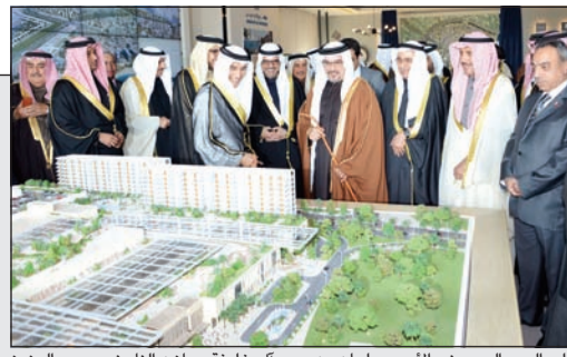
ولي العهد البحريني الأمير سلمان بن حمد آل خليفة ومارن التامض وعبد العزيز النفيسي خلال تدشين المشروع