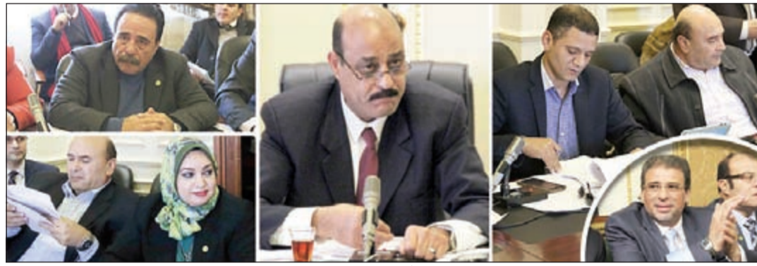
لقطات جمعة لأعضاء البرلمان خلال جلسات مناقشة قوانين التي أقرت خلال الفترة الماضية