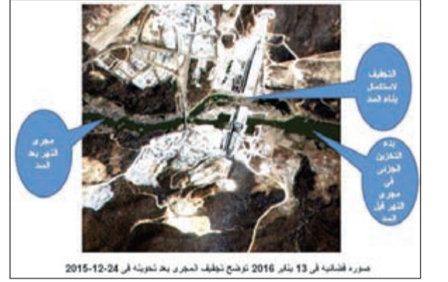
صورة فضائية في 13 يناير 2016 توضح تحفب النهرى بعد تجميد سد النهضة لقطة من الأقمار الاصطناعية لبحيرة سد النهضة