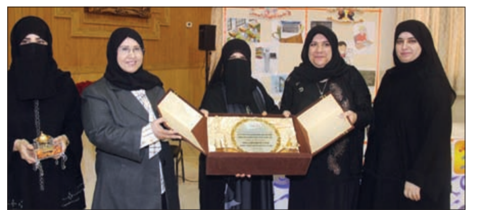
بدرية الخالدي تتسلم درعا تكريمية

تحت رعاية وحضور مدير عام منطقة العاصمة التعليمية بدرية الخالدي ومدير إدارة الشؤون التعليمية بالإنابة عادل الراشد، قدم قسم الرياضيات بمدرسة بوبيان متوسطة بنات ورشة عمل بعنوان «الرياضيات حلوة بس نفهمها»، والتي كانت من إعداد وتقديم معلمات قسم الرياضيات، وتناولت الورشة أهم الصعوبات والمشاكل التي تواجه معلم الرياضيات. وأشاد الحضور بما جاء في الورشة وبطريقة التقديم وبما فيها من أفكار واقتراحات لمواجبة الصعوبات التي تواجه معلمي الرياضيات وبما يساهم في تحقيق الفهم الأكبر عند الطلاب والطالبات وبما يجعل منها مادة محببة إليهم.