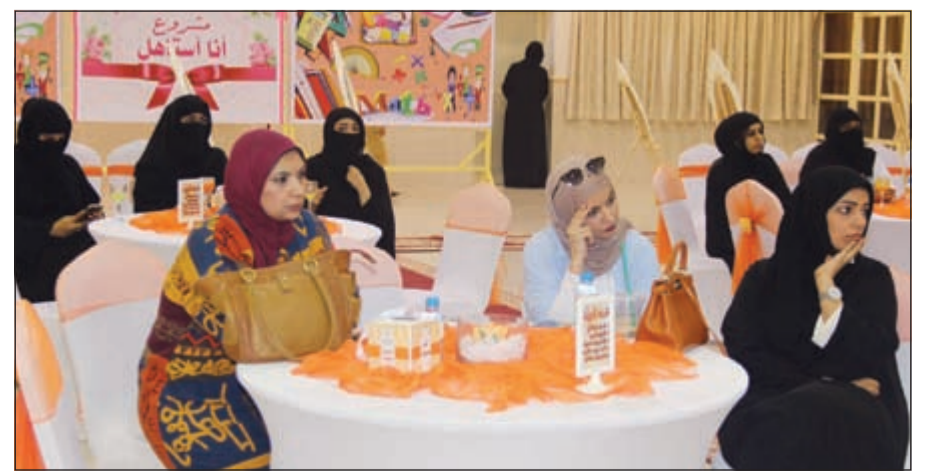
متابعة من العلمتات

تحت رعاية وحضور مدير عام منطقة العاصمة التعليمية بدرية الخالدي ومدير إدارة الشؤون التعليمية بالإنابة عادل الراشد، قدم قسم الرياضيات بمدرسة بوبيان متوسطة بنات ورشة عمل بعنوان «الرياضيات حلوة بس نفهمها»، والتي كانت من إعداد وتقديم معلمات قسم الرياضيات، وتناولت الورشة أهم الصعوبات والمشاكل التي تواجه معلم الرياضيات. وأشاد الحضور بما جاء في الورشة وبطريقة التقديم وبما فيها من أفكار واقتراحات لمواجبة الصعوبات التي تواجه معلمي الرياضيات وبما يساهم في تحقيق الفهم الأكبر عند الطلاب والطالبات وبما يجعل منها مادة محببة إليهم.