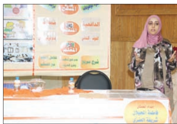
جانب من الورشة