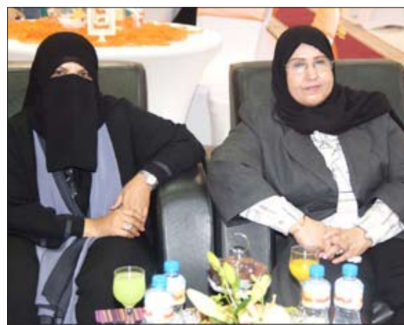
متابعة لورشة العمل