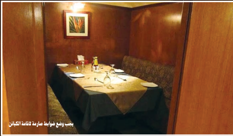
يجب وضع ضوابط صارمة لتأقمة الكباين