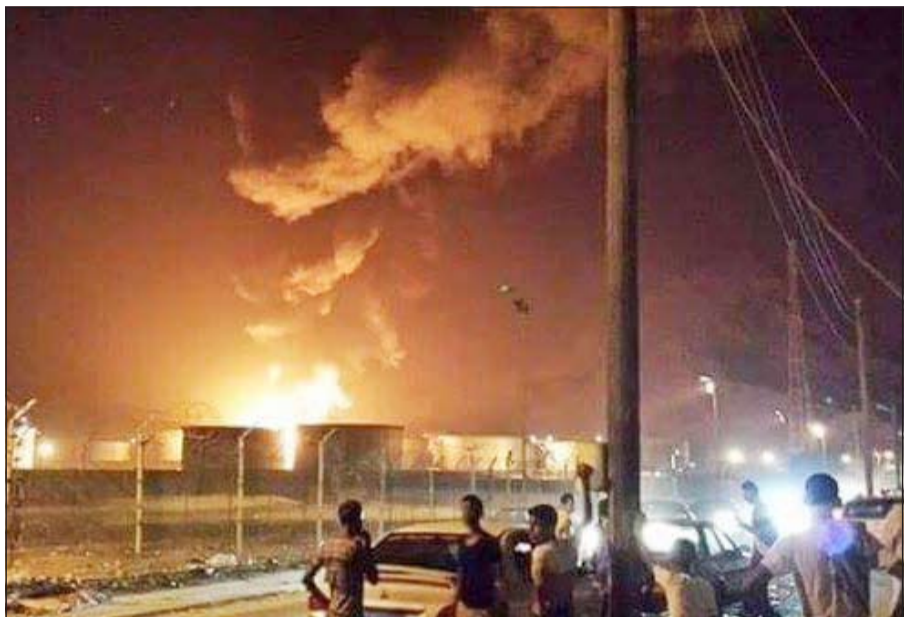
دخان كثيف يتصاعد جراء انفجار مصفاة عدن النفطية أمس (إياد أحمد)

واعلاميين، مشيرا إلى تلقيه ضمانات من الحوثيين بشأن سلامة وزير الدفاع اللواء محمود الصبحي الذي تحتجزه الجماعة ويمثل إطلاق سراحه هدفا أساسيا لحكومة الرئيس عبد ربه منصور هادي.