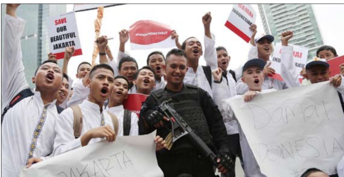
طلاب اندونيسيون في صورة جماعية مع رجل شرطة خلال تظاهرة رافضة للإرهاب غداة هجمات جاكرتا امس

بما في ذلك اندونيسيا وماليزيا والفلبين»، وحث نعيم أتباعه الإندونيسيين في توتينة بعنوان «دروس من هجمات الإندونيسية» على دراسة التخطيط واختيار الأهداف والتوقيت والتنسيق الشجاعة التي تحلى بها منفذو هجمات باريس. وفي غضون ذلك، تجمع عشرات الإندونيسيين بعضهم يحمل الزهور، في موقع هجوم جاكرتا وهنقوا معا «لسنا خائفين!» و«حاربوا الإرهابيين!» ونشروا رسالة تحد عبر مواقع التواصل الاجتماعي بيهتاج عبر موقع تويتر مثل: «لسنا خائفين» و«جاكرتا جسورة».