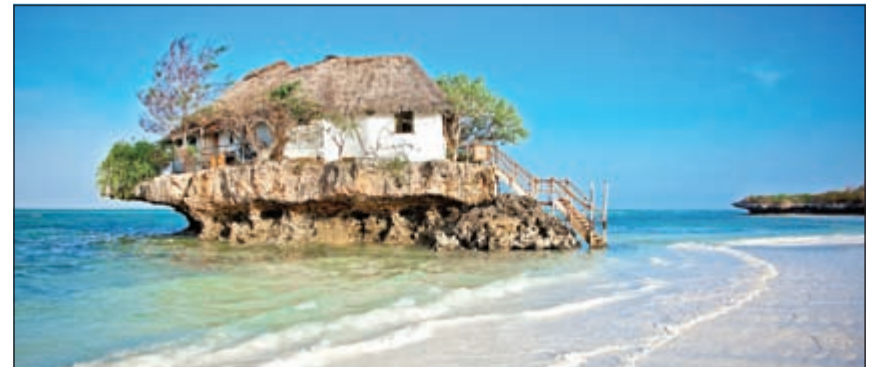
مناظر طبيعية ممتعة في جزيرة زنجبار

للفراشات، أو محمية «مناراني» للسلاحف البحرية، أما إذا كنت تتمتع بقدر كبير من الشجاعة، فتوجه إلى حديقة حيوانات «شيتاز روك».