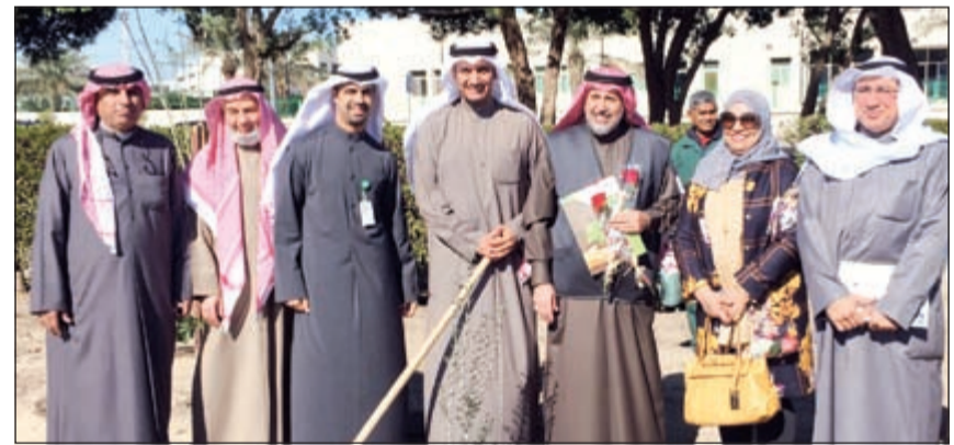
جانب من افتتاح الحديقة

تخضير مستقبلية شاملة، وبإبعاد ترويجية وبيئية وحضارية واجتماعية، تنفذها الهيئة العامة لشؤون الزراعة والثروة السمكية. ويبدل «بيتك» جهودا متواصلية من أجل تعزيز وترسيخ مفاهيم الثقافة البيئية والبيئة الخضراء التي تعتبر من أهم دوافع ومحركات التنمية المستدامة التي يتطلع إليها المجتمع، ما يؤكد ريادته في تحقيق المسؤولية الاجتماعية، وحرصه على تعزيز ثقافة الوعي البيئي في أكثر من مجال، لما لها من أهمية في حياة المجتمع.