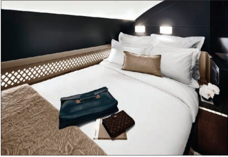
غرفة النوم الرئيسية داخل مقصورة الإيوان

تقدم أيضا مقصورة «الإيوان من الاتحاد» خدمات الإنترنت اللاسلكي والمجهزة بأحدث أنظمة التسلية من باناسونيك eX3 للتسلية، مع تعزيز الألعاب وتوفير شاشة عالية الوضوح تعمل باللمس. تنفرد «الإيوان من الاتحاد» بتصميمها الخلابة، مثل نوع السجاد المستخدم، الطاولات الخشبية المطلعة بالزخارف، كل ذلك يخلق للمسافرين الأجواء الفخمة ذات الخصوصية التامة متوافرة على الطائرة من طراز A380 تحوي التصميم المستوحاة من أفخم طرازات الضيافة.