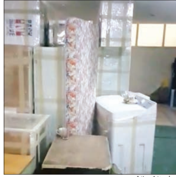
.. وأجهزة كهربائية