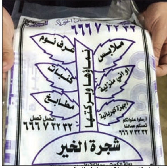
بروشورات كانت العصاة توزعها على السكان