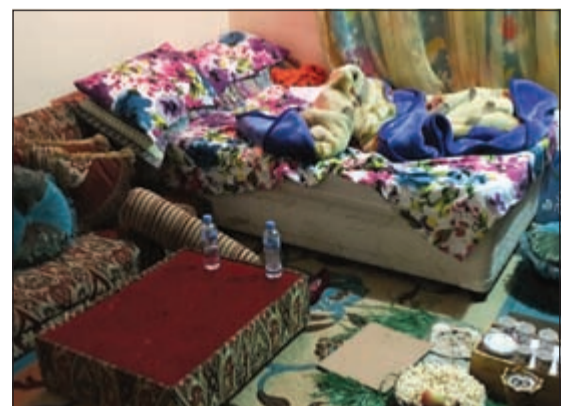
غرفة بأحد الوكرين

قصد وردت من قبل مصادر خاصة بالفرقة عن بعض الأوكار المشبوهة في قطعة 2 بمنطقة المهبولة وبعد رصد ومراقبة موقع البلاغ لعدة أيام داهمت الفرقة وبنايتين في المنطقة تستخدمان في الترويج للرزيلة.