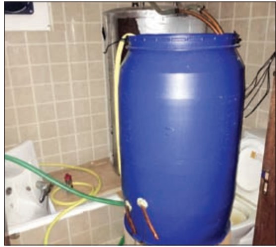
برميل معد لعملية التقطير

إِنَّا لِلَّهِ وَإِنَّا إِلَيْهِ رَاجِعُونَ