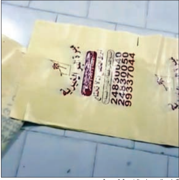
أكياس الجمعيات الخيرية الوهمية