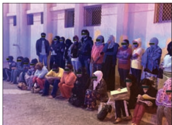
النساء اللاتي تم ضبطهن