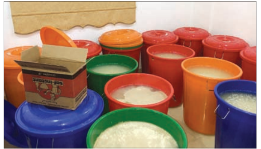
براميل معبأة بالخمر المحلية

عبدالله سفاح، اشتبهت في شخصين، وعندما حاولت توقيفهما للاطلاع على أوراقهما الخبوتية، لاذا بالفرار وبخلا إحدى بنايات منطقة المنقف، فطاردتهم الدورية حتى تم ضبطهما بإحدى الشقق، وتبين