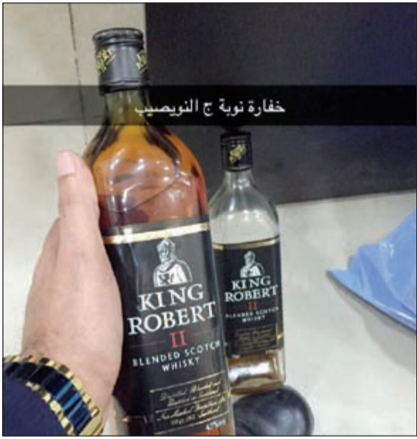
خفارة نوبة ج النوصيب