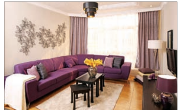
من مسابقة العام الماضي - بعد الفوز