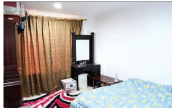
من مسابقة العام الماضي - قبل الفوز