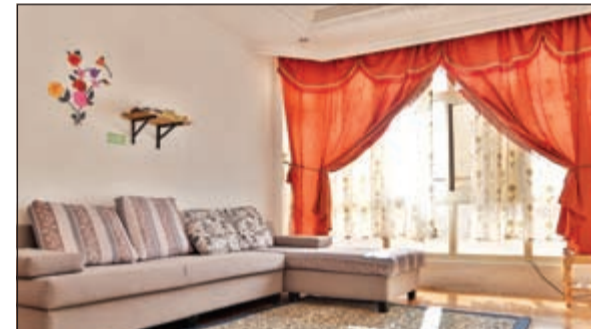
من مسابقة العام الماضي - قبل الفوز

بدوره، قال الرئيس التنفيذي لهوم سنتر، مديريك بابن: «تعتبر مسابقة هوم سنتر