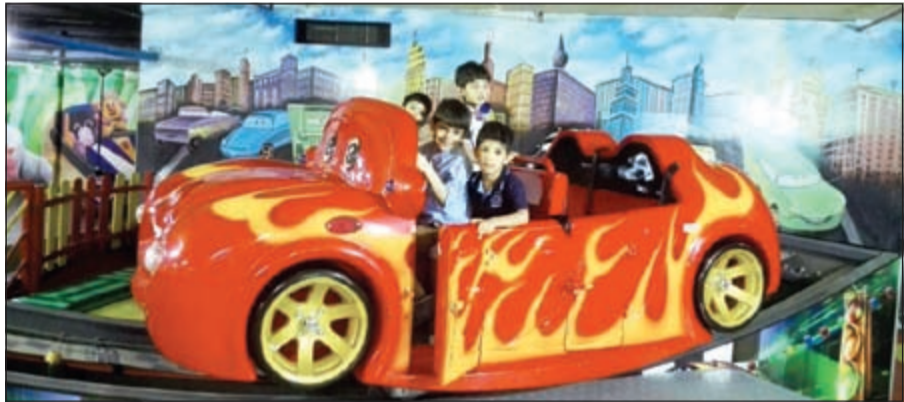
من الألعاب الجديدة

استعدادا لموسم الإجازات والعطلات استعدت أرض الأطفال الرائدة بالألعاب الترفيهية والتربوية بالكوت مجموعة من الفعاليات والبرامج الجديدة والمتنوعة التي تناسب الأطفال، وتتميز قدراتهم ومواهبهم، وتشجعهم على اللعب الجماعي بما يدخل الفرح والبهجة إلى قلوبهم من خلال توفير الألعاب الشائقة بأنواعها المختلفة، بالإضافة إلى أنه تم وضع آلية جديدة من خلال برنامج خصومات داخلية بفروع الشركة في كل من مجمع الأوقاف بشرق ومجمع مغاتير بالفروانية والخيمة مول والعالية مول بالجهراء، وكذلك العروض على المهرجانات الخارجية، وأعياد الميلاد الخارجية. وفي السياق ذاته، تقيم أرض الأطفال حفلات للأطفال بمجمع الأوقاف في اوقات متفرقة لتلبية رغبات الأطفال وكذلك سيكون هناك برنامج متمم وهدايا خاصة بمناسبة مهرجان هلا فبراير بجميع فروع الشركة المنتشرة بالكويت. وجدير بالذكر أن أرض الأطفال استعدت مجموعة من الألعاب الهوائية كالتطابقات والزحافات، والمائية كملاب الصابون استعدادا لموسم الاجازات للتمتع بتلك الخدمة داخل المنازل، بالإضافة إلى ان الشركة عيّنت أخيراً فريقاً كاملاً ومترسلاً ومترسلاً للمحافظة على سلامة الأطفال من المخاطر.