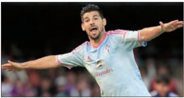
النجم نوليتو والحرب عليه

نقى مانويل نوليتو لاعب سلتا فيغو انتقاله إلى صفوف نادي برشلونة، مشيرا إلى أنه مثل الجميع يستمع إلى هذه الأخبار عن طريق الصحافة. وأضاف نوليتو وفقا لتصريحاته التي نقلتها صحيفة سبورت الكاتالونية أنا هنا في سلتا فيغو ولدي عقد مع الفريق وأنا متراح هنا.