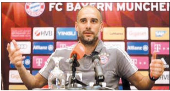
المدير الفني لنادي بايرن ميونخ الألماني غوارديولا

أعاد الإسباني بيب غوارديولا المدير الفني لنادي بايرن ميونخ الألماني تصريحاته السابقة بأنه يستهدف الدوري الإنجليزي بعد رحيله المؤكد من العملاق البافاري إلى نقطة الصفر. وقال الفيلسوف غوارديولا في تصريحاته نقلها شبكة سكاى سبورت البريطانية: عندما أوقع على عقود بشكل رسمي الجميع سيعلن ذلك على الفور. وتابع: قد يكون الأمر مجرأ أن أكون مدربا في إنجلترا وقد انتقل إلى البريميرليغ بعد عامين من الآن، أنا سعيد بتجربتي هنا في ميونخ للغاية، وسأعمل حتى الثانية الأخيرة في عقدي.