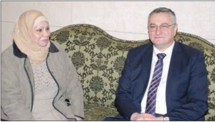
مفتي جمهورية كرواتيا عزيز حسانوفيتش يتحدث للزميلة ليلى الشافعي