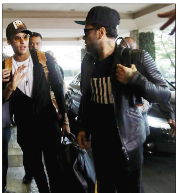
مشادة حادة بين النجمين راكيتيتش.

دخل البرازيلي داني الفيس مدافع برشلونة والبرتغالي كريستيانو رونالدو مهاجم ريال مدريد في مشادة كلامية الذهبية السذي أقيم يوم أمس الأول، حيث توترت الأجواء بين اللاعبين في الفندق الذي تواجد فيه الحاضرون للحفل