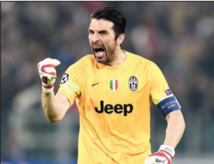
الأسطورة جالوجي بوفون غاب عن قائمة الثلاثة المرشحين

غابت إيطاليا عن التصويت على جائزة أفضل لاعب في العالم التي يمنحها الاتحاد الدولي لكرة القدم (فيفا) ومجلة «فرانس فوتبول» الفرنسية، وذلك احتجاجا على عدم تسمية قائد المنتخب الوطني ويوفنتوس الحارس جالوجي بوفون عن لائحة المرشحين، وذلك بحسبما كشفت وسائل الإعلام المحلية. وأكدت اللائحة التي نشرها الاتحاد الدولي عدم تصويت مدرب المنتخب الإيطالي أنتونيو كونتي والقائد بوفون لأنها قفزت مباشرة من إسرائيل إلى جامايكا دون المرور بإيطاليا التي تمثلت فقط في التصويت بصوت الصحافي. وكشفت صحيفة «غازيتا ديلو سبورت» الرياضية عن أن امتناع كونتي وبوفون عن التصويت جاء بتوصية من الاتحاد الإيطالي لكرة القدم الذي اتخذ قراره منذ نوفمبر بعد أن غاب حارس «الأزوري» وقائده عن اللائحة الأولية المكونة من 59 لاعبا والتي ضمت خمسة حراس مرمي هم الألماني مانويل نوير والإسباني إيكر كاسياس والبلجيكي تيبو كورتوا والتشيلي كلاوديو برافو والكولومبي دافيد أوسبيننا.