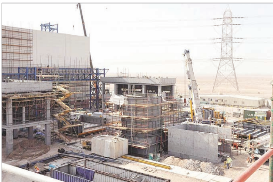
المرحلة الثالثة من توسعة مجمع الصبية ستعرف الطاقة الانتاجية بواقع 750 ميغاواط من الكهرباء

للبلاد من الكهرباء لمواجهة الطلب المتزايد على الطاقة وبوتيرة سريعة مستمداً الزخم من النمو السكاني المتسارع، وتقدر الوزارة أنها ستحتاج إلى 10500 ميغاواط كطاقة إضافية لمواجهة الطلب المتوقع عند الذروة بحلول 2022.