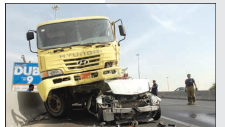
سرعة مفرطة وكسر للقوانين