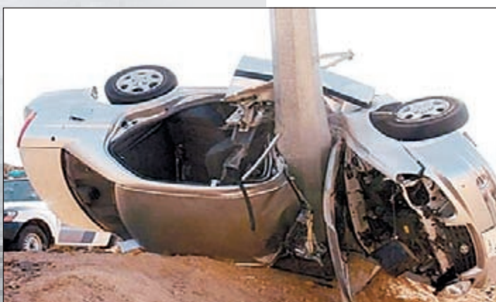
مصير القيادة المتهوره