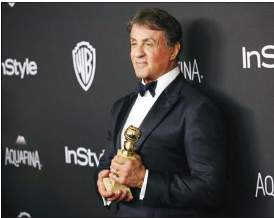
سيلفستر ستالون وجائزة عن فيلم «عقيدة»

لوس انجليس - أ.ف.ب: تصدر فيلم «العائد» مسابقة غولدن غلوب هذا العام بحصوله على ثلاث جوائز. وفاز الفيلم بجائزة أفضل فيلم ليويناردو دي كابريو بجائزة أفضل ممثل في فيلم درامي، في حين كانت الجائزة الثالثة من نصيب مخرج الفيلم أليخاندرو إيناريتو. وقال مخرج العمل «أتوجه بالشكر لكل الأميركيين الأصليين الذين ساهموا في إنجاح هذا العمل. لا يمكنني التعبير عن دهشتي وفخري بإنجاح هذا العمل بمساعدة كل طاقمه»، ويأتي هذا الفوز بعد منافسة قوية مع فيلم «كارول» الذي لم يحصل على أي من الجوائز التي رشح لها. وفاز فيلم «المرخي» بجائزتين الأولى في فئة أفضل فيلم كوميدي أو غنائي، بينما كانت الأخرى من نصيب الممثل مات ديمون كأفضل ممثل في نفس الفئة. وفي البطولات النسائية، فازت الممثلة جنيفر لورانس بجائزة أفضل ممثلة في فيلم كوميدي، عن فيلم «جوي». كما فازت الممثلة بري لارسون في فئة الأفلام الدرامية عن دورها في فيلم «غرفة».