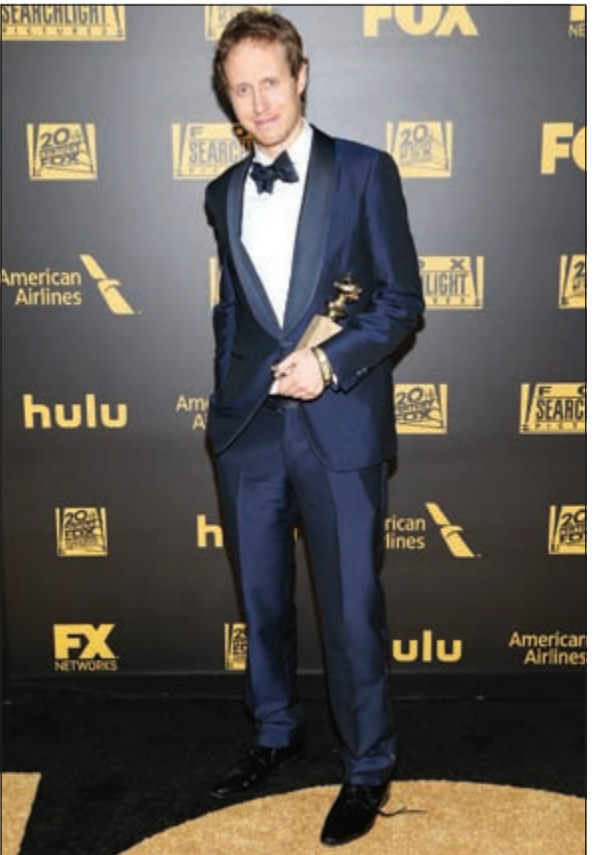
غاييل غارسيا بيرنال وجائزة أفضل ممثل عن مسلسل «موزارت في الغابة»

وفي فئة الأدوار المساعدة، فازت الممثلة كيت وينسلت عن دورها في فيلم «ستيف جوبس». كذلك فاز الممثل سيلفستر ستالون عن دوره في فيلم «عقيدة». وفاز فيلم «إنسايد أوت» بجائزة أفضل فيلم رسوم متحركة، وهو أحد عملي