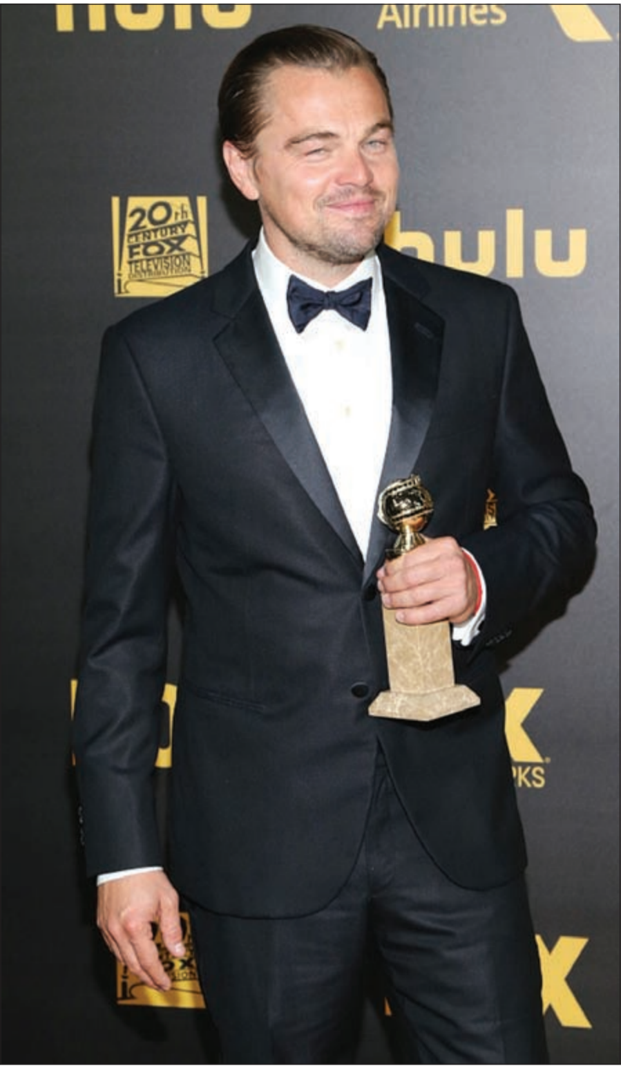
دي كابريو وجائزة عن «العائد»