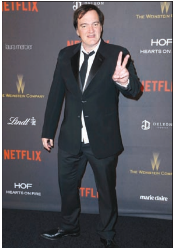
كوينتين تارانتينو مخرج فيلم الثمانية المكروهون