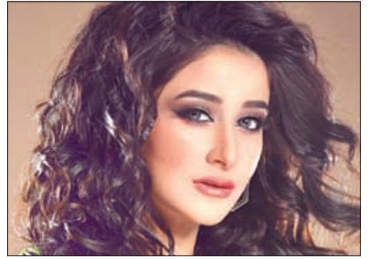
الفنانة أسيل عمران

أعلنت الفنانة السعودية أسيل عمران من خبر طلاقها عبر صفحتها عبر انستغرام بعد أن ثارت الكثير من الأقاويل في وقت سابق حول طلاقها للمرة الثالثة من زوجها الإعلامي البحريني خالد الشاعر. وكتبت أسيل باسمها واسم طليقها عبر انستغرام بعد كثرة الحديث عبر وسائل الإعلام وشبكات التواصل نود الإعلان عن الطلاق رسمياً مع الاحتفاظ بكامل الود والاحترام اللذين تميزت بهما علاقتنا دائماً. وكانت أسيل عمران قد انفصلت عن زوجها خالد الشاعر مرتين سابقتين قبل أن يعودا لبعضهما للمرة الثالثة في شهر أغسطس من العام الماضي.