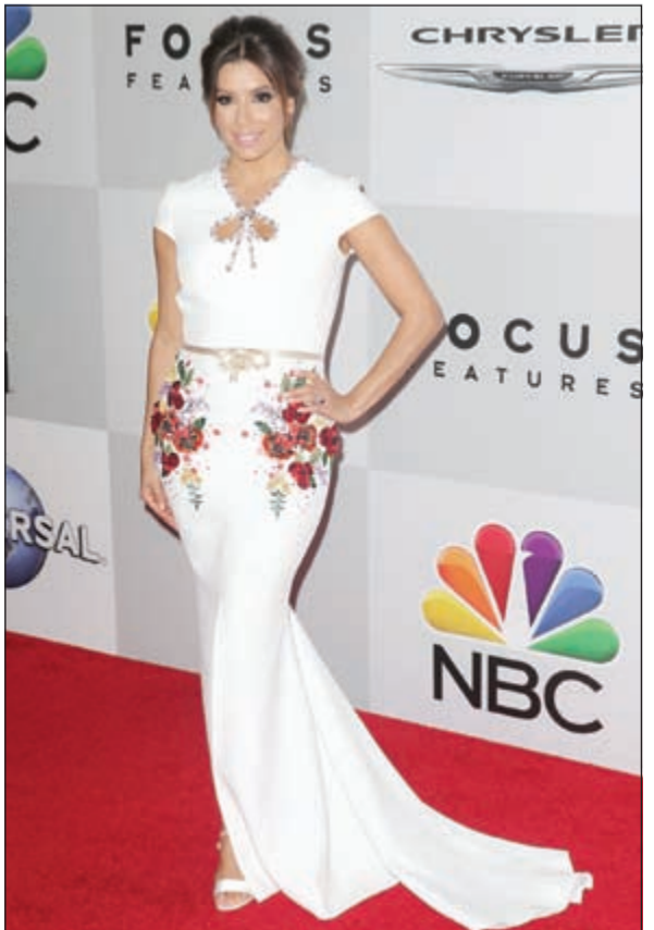
أليسا لونغوريا أبرز النجمات اللاتي حضرن