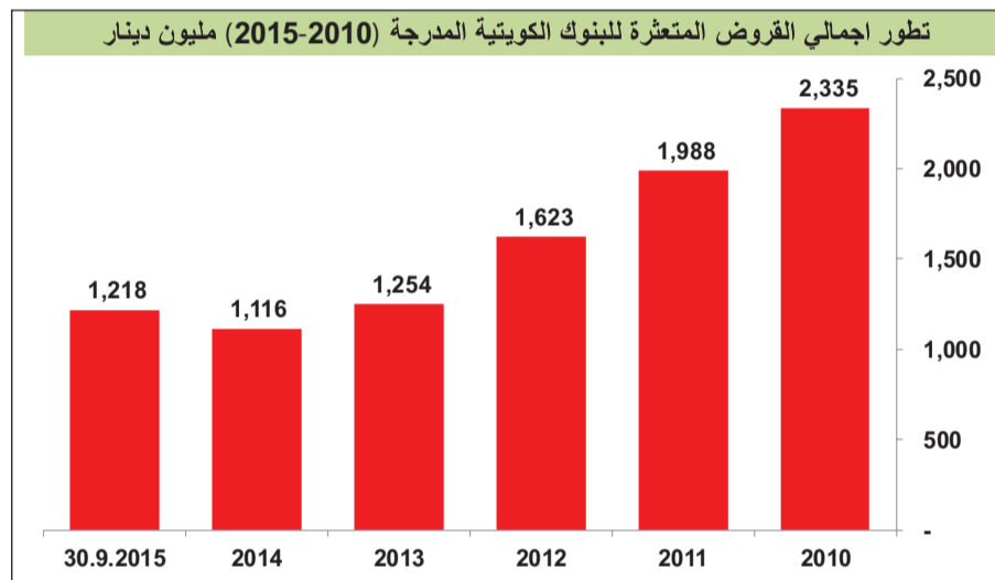
بيانات: بنك الكويت المركزي - خاص «الأنباء»