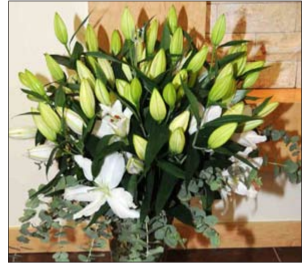
باقة جميلة من الشبخة ببيبي اليوسف في عيد «الانباء» الـ 40

أشادوا بدورها الوطني وتمنوا لها دوام التقدم والازدهار لتبقى في الريادة