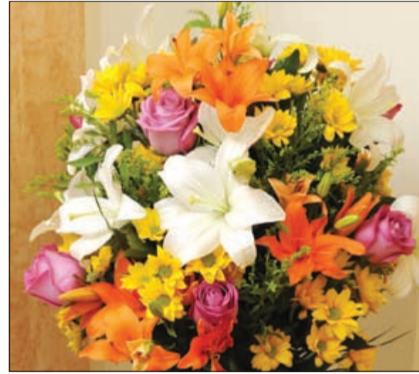
مجموعة الامتياز الاستثمارية عابدين «الانباء» بالزهور