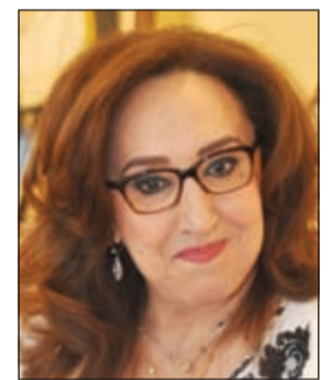
الشبخة ببيبي اليوسف

باسمى آيات التهنئة، ووافر التبريكات بمناسبة مرور 40 عاماً على صدور جريدة «الانباء». وذلك لما لمسناه من حرية رأي وثوابت وطنية رسخت دعمها بالممارسة الديمقراطية المعبرة عن الوجه الحقيقي للحضارة الكويتية، متمنياً لكم ولجريدتكم الغراء مزيداً من التوفيق والسداد.