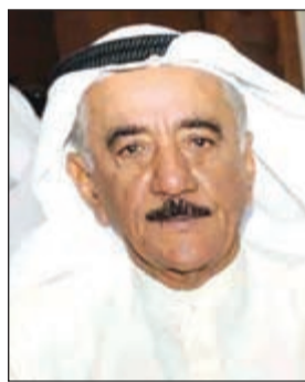
اللواء م. جاسم المنصوري