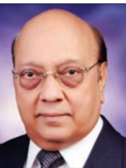
ساماني جاك ديب