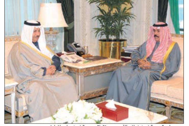
سمو ولي العهد الشيخ نواف الأحمد مستقبلاً سمو الشيخ جابر المبارك

بمجلس الوزراء. كما استقبل سمو ولي العهد بقصر السيف صباح أمس نائب رئيس مجلس الوزراء ووزير الدفاع الشيخ خالد الجراح. كما استقبل سمو ولي العهد الشيخ نواف الأحمد بقصر السيف صباح أمس