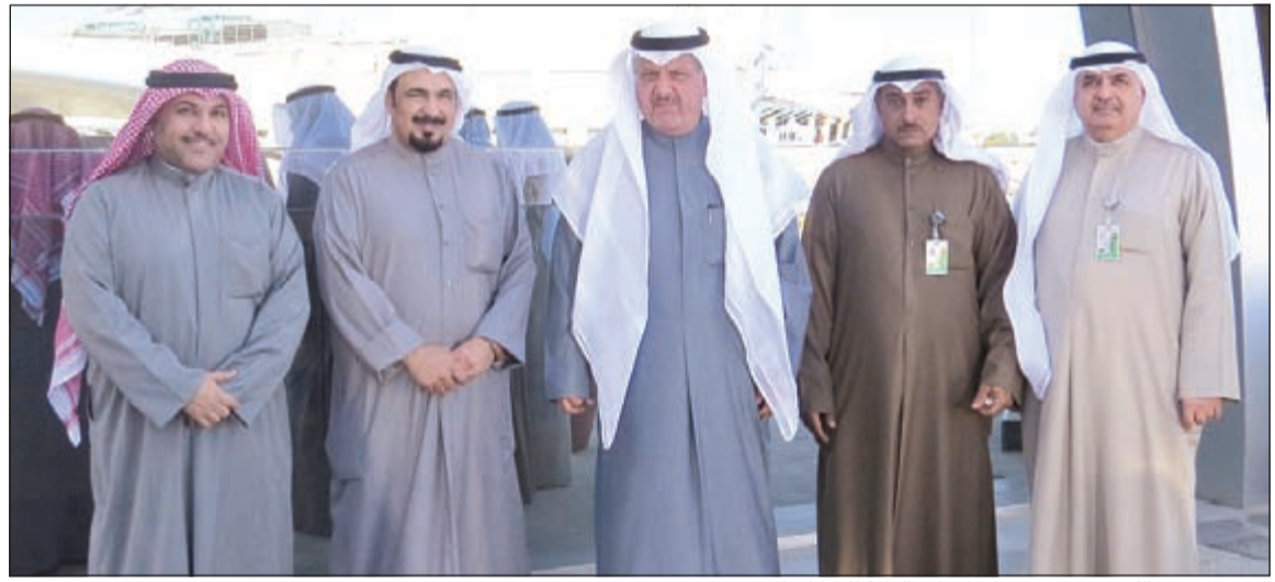
الوزير عيسى الكندري مع مسؤولي الإدارة العامة للطيران المدني

وأوضح ان الوزير طالب الإدارة العامة للطيران المدني بموافاته بتقرير أسبوعي عما يتم من معالجات والتي ستسكون تحت الإشراف الميداني من الوكلاء المساعدين في القطاعات المعنية.