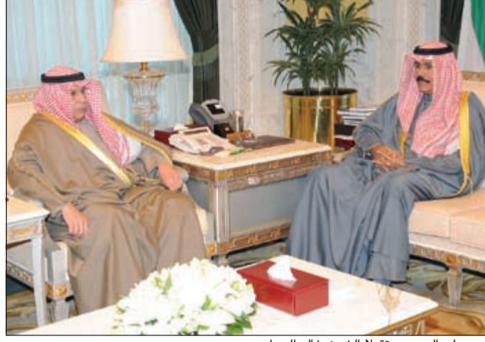
سمو ولي العهد مستقبلاً الشيخ خالد الجراح