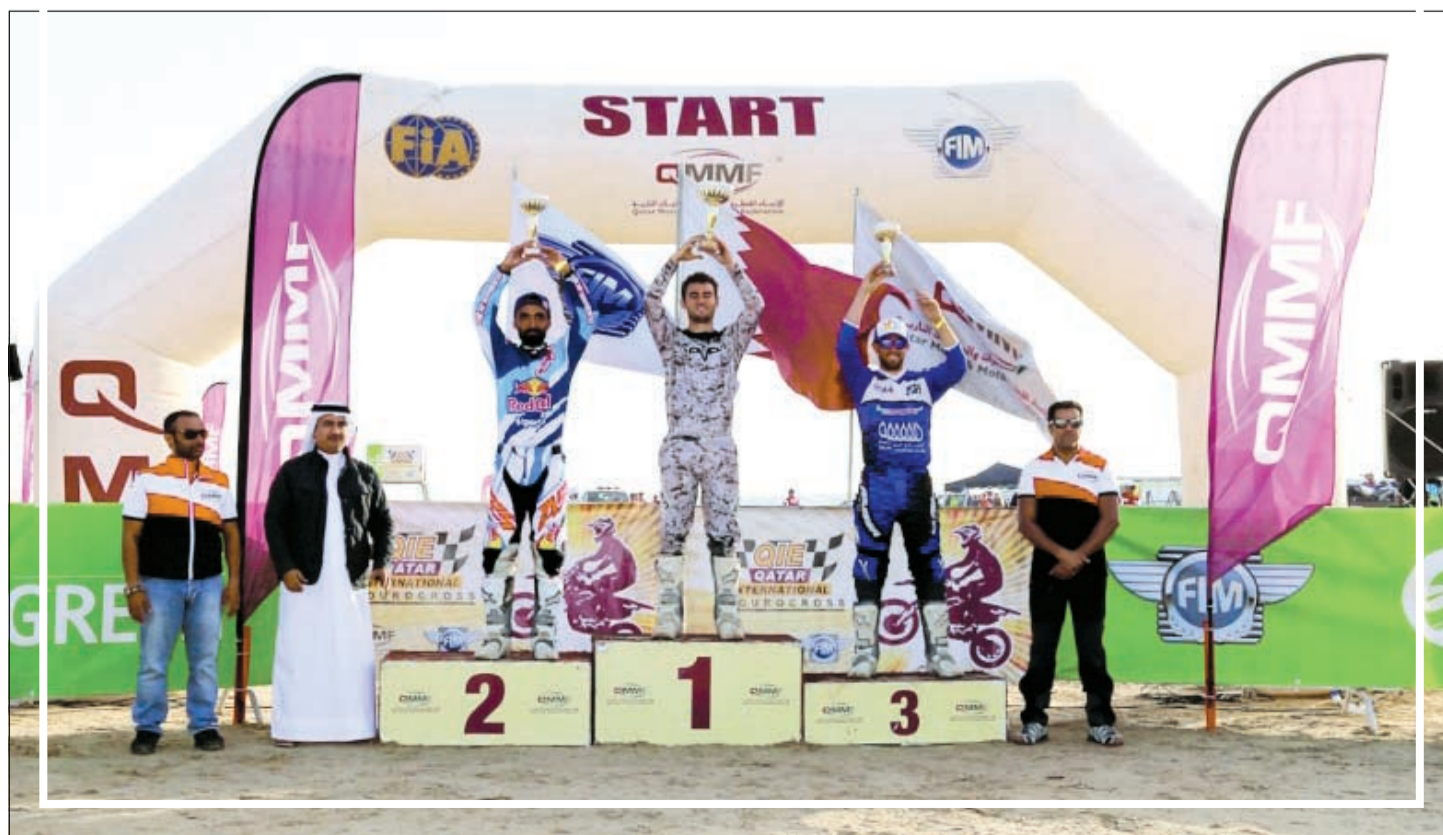
الابطال على منصة التتويج