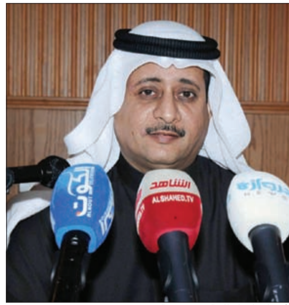
الأمين المساعد لقطاع الفنون ديدر الدويش