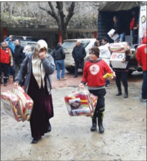
جانب من حملة جمعية الهلال الأحمر «الشتاء الدافئ» 2016»