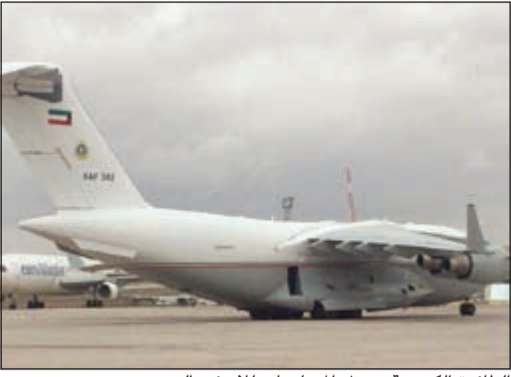
الطائرة الكويتية تحمل المساعدات للاجئين السوريين