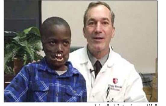
الطفل مع طبيبه قبل العملية

نيويورك - رويترز: تجري لطفل عمره ثمانية أعوام جراحة نادرة بأحد مستشفيات نيويورك لزراعة شفتين بعد أن فقدهما خلال هجوم من حيوانات الشمبانزي أثناء لوهو قرب نهر في مسقط رأسه بجمهورية الكونغو الديمقراطية.