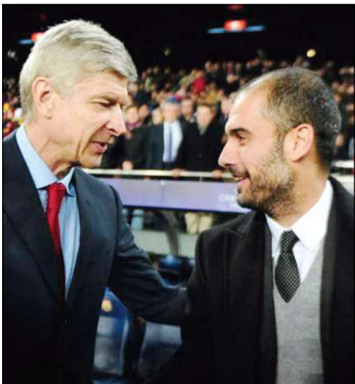
الفيلسوف غوارديولا يساوجه الثعلب فينغر في إنجلترا

قال مدرب أرسنال آرسن فينغر إن تفصيل بيب غوارديولا لتوقيع عقود مدتها ثلاث سنوات لن يمنعه من الإشراف على تدريب أرسنال. وسيبحث المدرب الإسباني عن تجربة جديدة بعد نهاية الموسم الحالي حيث ينتهي عقده مع بايرن ميونخ وأعلن مؤخرًا رغبته في التدريب بالبريميرليغ.