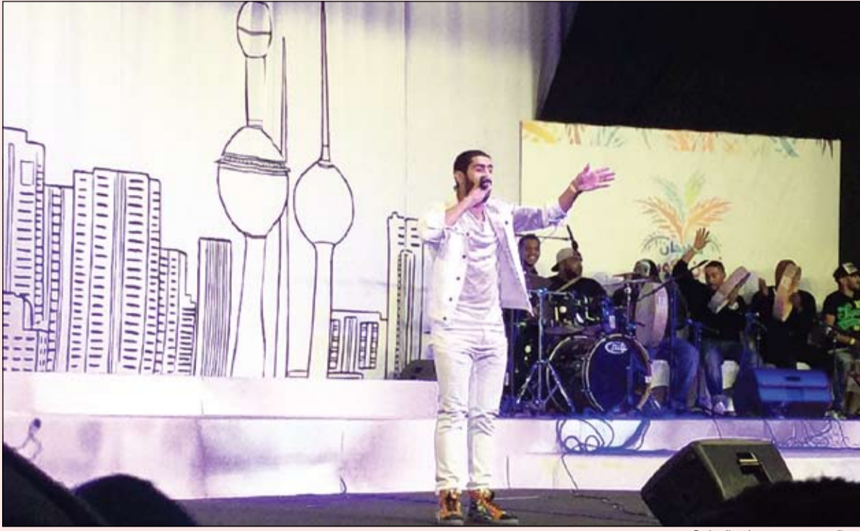
بدر الشعبي في وصلته الغنائية

بعد ذلك صعد الى خشبة المسرح الفنان بدر الشعبي الذي رغم تجربته الغنائية القصيرة إلا أنه أثبت جماهيريته كمطرب شاب، وغنى ورقص بإبداع أمام الجمهور الذي زحف الى المسرح ليكون شريكاً في هذا النجاح، بدأ الشعبي وصلته الغنائية باغنيته بمصاحبة فرقة الحملي دريم قبل ان ينطلق في أولى أغانيه الرسمية «تري زهفة» التي حاول من خلالها جس نبض الجمهور، وفعلاً تفاعل معه الجمهور بشكل كبير، مما جعله يركز على الأغنيات السستابل والسريعة منها «من مكانة» ثم «قلبي قلبي» ثم عاد الى اللون الرومانسي في أغنية «علموه»، ثم عاد الشعبي الى الأغاني السريعة التي يحفظها جمهوره فترك لهم فرصة الغناء بمفردهم في أغنيات «الي العساق» و«اي مشتاقي» ثم اختار أغنية «أينسكاهم» للفنان نبيل شعليل ومن ثم ختم وصلته الغنائية بأغنية وطنية.