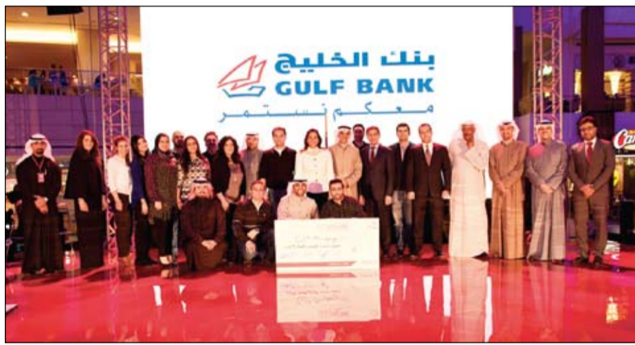
فريق بنك الخليج في سحبه السنوي التاجح «3 في 1»

أعلن بنك الخليج عن الفائزين في سحبه السنوي «3 في 1» الذي نظمت فعالياته امس الاول الخميس في مجمع الأقنيوز، وقد تم إجراء 3 سحبيات في نفس الوقت ونفس الموقع، وأجريت سحب الدانة على جوائز نقدية بقيمة مليون دينار، و250 ألف دينار، و50 ألف دينار، بينما تضمن سحب حسابي الراتب red جائزة سيارة كاديلاك SRX جديدة وجائزتين نقديتين بقيمة 25 ألف دينار لكل منهما بالإضافة إلى جوائز نقدية تصل إلى 1,500 دينار، وقد أجريت السحبيات تحت إشراف وحضور ممثل عن وزارة التجارة والصناعة.