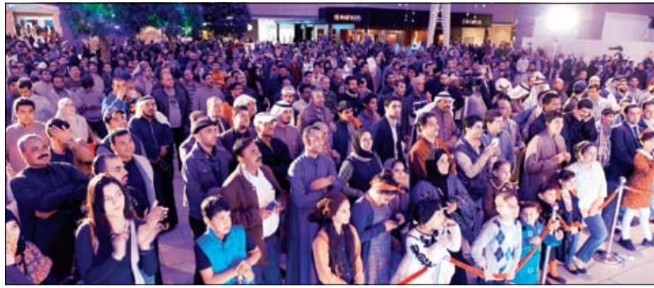
جانب من الحضور خلال السحب السنوي «3 في 1»