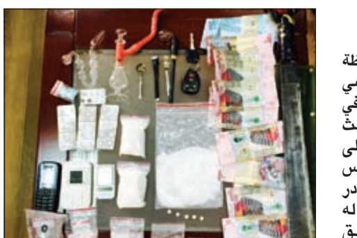
أكياس الشببو وأدوات التعاطي