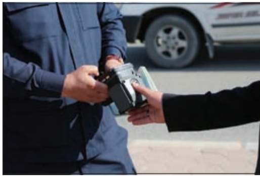
البصمة التعريفية كانت حاضرة في الحملة