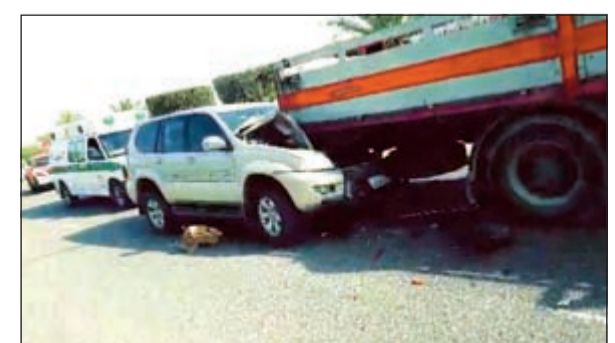
المركبة التي اصطدمت بالشاحنة