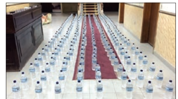
الخمور التي عثر عليها مع الاسويين