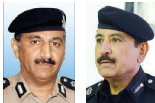
اللواء فهد الشويح