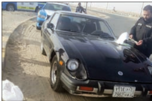
إحدى المركبات التي تم ضبطها بالحملة