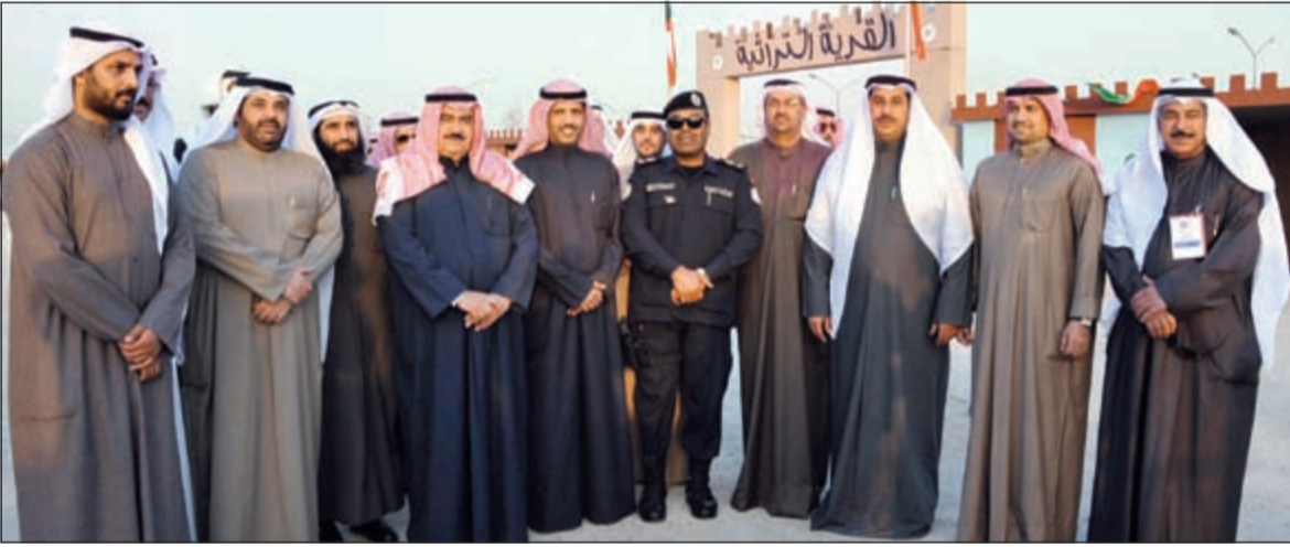
المهنا وعدد من المشاركين في الافتتاح