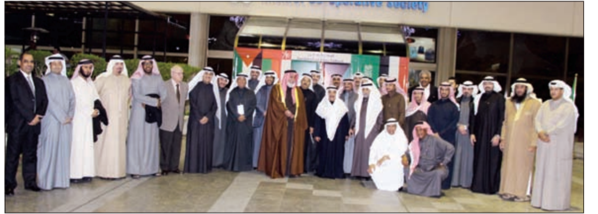
صورة جماعية للوفد الخليجي مع رئيس وأعضاء مجلس إدارة تعاونية مشرف