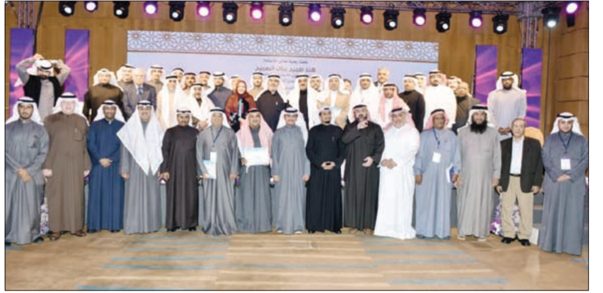
صورة جماعية للمشاركين في الملتقى التعاوني الثالث

عبدالله الركان افتتح محافظ العاصمة الفريق مقاعد ثابت المهنا، فعاليات القرية التراثية بمنطقة القيروان يوم أمس الأول، بحضور مختار المنطقة ومسؤولي جمعية القيروان، وجمع غفير من الأهالي. وقال المهنا، في كلمة للصحافيين إن القرية التراثية من المواقع السياحية والترفيهية التي تحمل عبقا تراثيا وتاريخيا، والتي يحرس الكثيرون على زيارتها، لاسيما أنها تتضمن جميع العناصر العصرية الأساسية، من متاحف تراثية، ومسارقات وجوائز، وعروض ترفيهية، ومحال شعبية، وألعاب كثيرة، ومطاعم متنوعة. وتمنن جهود كل من ساهم في إنشاء القرية وتوفير المرافق والخدمات بها، من أجل توفير الراحة والمتعة لروادها، ليقضوا أوقاتا سعيدة وسط الأجواء الريفية الرائعة، وتكون متنفسا شعبيا وتراثيا لهم. من جانبه، أكد رئيس