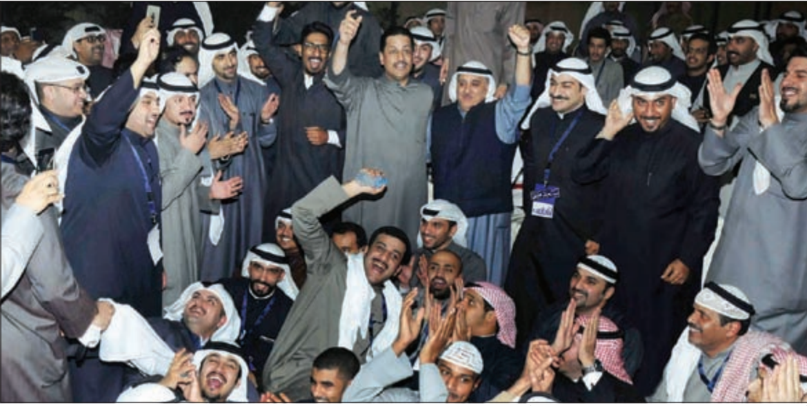
أعضاء قائمة المحامي يحتفلون بالفوز بـ 5 مقاعد من أعضاء مجلس الإدارة (محمد خلوصي)