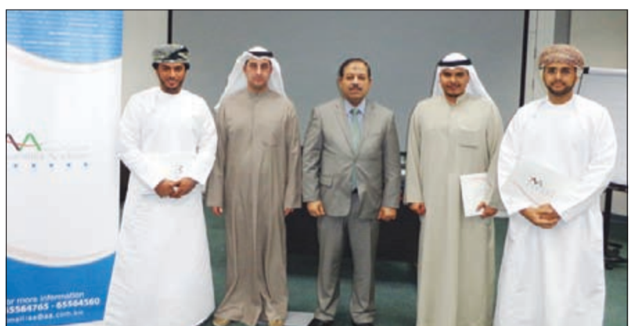
المشاركون في البرنامج التدريبي

تجاه مختلف الجهات والمؤسسات في الكويت، وقد دأبت الأكاديمية على توفير أبرز الخبراء والمتخصصين للاستفادة من خبراتهم، وإثراء معارف المشاركين بأبرز المستجدات لمواكبة التحديات والتطورات في سوق العمل. وفي ختام البرنامج، قدمت الأكاديمية الأسترالية الشهادات التقديرية للمشاركين بحضور ممثلين من إدارة التدريب في ديوان المحاسبة ومن الأكاديمية الأسترالية، وتم تقديم الشكر والتقدير لإدارة التدريب في ديوان المحاسبة على ثقتهم بالتعاون مع الأكاديمية الأسترالية على تنفيذ البرنامج