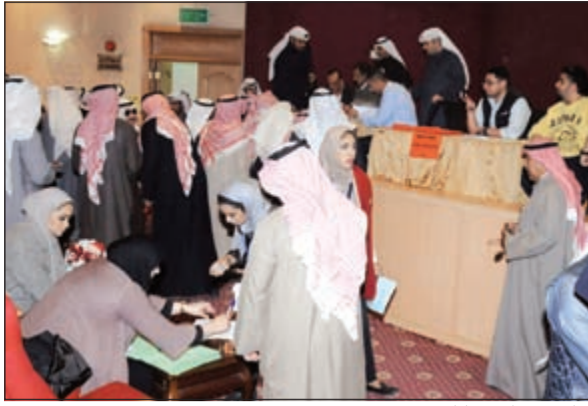
جانب من الانتخابات