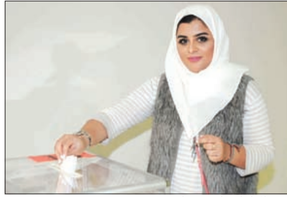
إحدى المحاميات تلي بصوتها