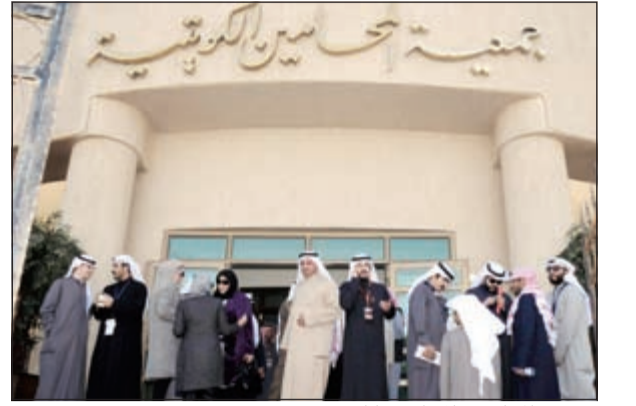
عدد من المحامين خلال الانتخابات