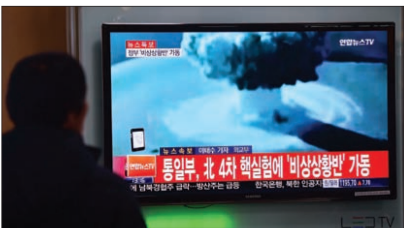
اشخاص في سيئول يتابعون تقريراً عن أول تجربة هيدروجينية تجريبها كوريا الشمالية

عوامس - وكالات: أثارت كوريا الشمالية موجة استنكار دولية واسعة أمس، بعد إعلانها نجاح أول تجربة لقنبلة هيدروجينية، فيما تدعى مجلس الأمن للانعقاد لبحث الخطوة التي اعتبرها المندوبون «انتهاكاً» لقرارات الأمم المتحدة. وجاءت التجربة بطلب من زعيم كوريا الشاب كيم جونج أون، في تحد واضح للمجتمع الدولي، حيث اعتبر