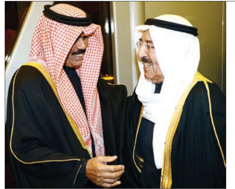
صاحب السمو الأمير الشيخ صباح الأحمد لدى عودته إلى البلاد أمس وفي استقباله سمو ولي العهد الشيخ نواف الأحمد

المنامة - بنا: أعلنت البحرين إحباط مخطط إرهابي لتنفيذ سلسلة من الأعمال التفجيرية الخطيرة في المملكة بدعم من إيران. وقالت وزارة الداخلية البحرينية في بيان، أمس، إنه تم «تحديد هوية أعضاء تنظيم إرهابي سري (قرب البسطة) المدعوم مما يسمى بالحرس الثوري الإيراني ومنظمة حزب الله الإرهابية، والقض على عدد من المُنظِّمين بالتنظيم والمثوريين بإرتكاب سلسلة من الجرائم الإرهابية الخطيرة». التفاصيل ص 26