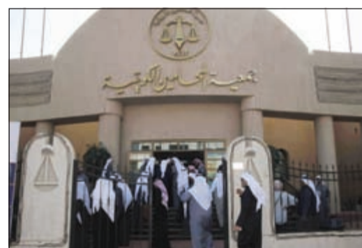
إقبال كبير في انتخابات جمعية المحامين (محمد خلوصي)

قائمة «المحامي» تفوز بـ 5 مقاعد مقابل 4 لـ «المحامين» في انتخابات «الجمعية»